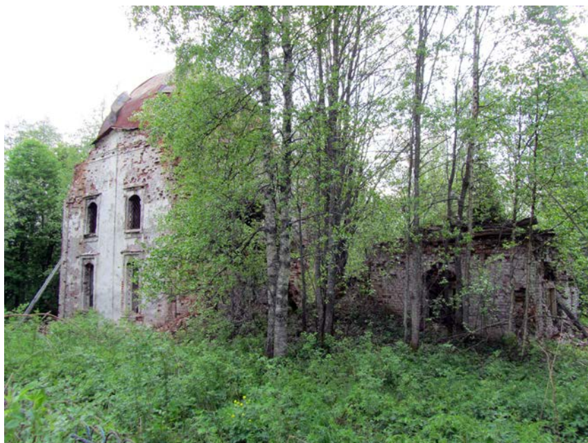
Foto 2. Koguduse peakirik – Jumalaema ikooni ilmumise kirik pühade apostlite Peetruse ja Pauluse nimel. Andrei Baškarevi foto 2012.