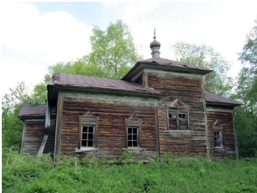
Foto 1. Šimjärve püirkonna vanim kirik – Jüri (vn Georgi) kirik (puust, ühe altariga), ilma kellatornita.