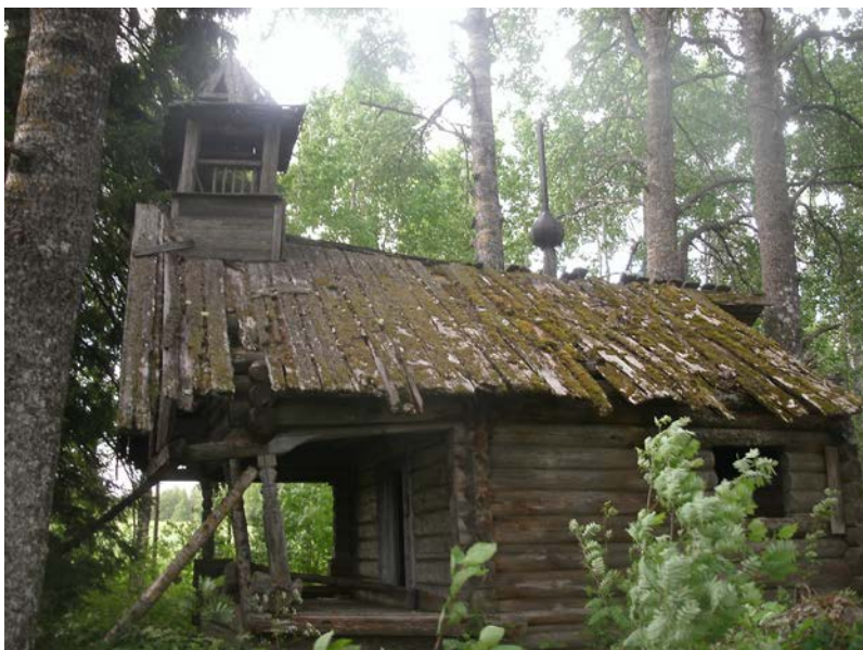
Foto 3. Kellatorniga kabel pühakute Cyricuse ja Julitta auks Kivinemi külas.

Šimjärve piirkonnas oli kolm kabelit kolmest-neljast külast koosneva külastu keskmeks (Pütkas'k, Vaht'k'ar, Väräsär), seitse kabelit ühendas kahte küla ja ainult neljas külas (Ran'jone, Kivinem', Ivanan Sarg, Tukšar) oli oma kabel (tabelid 1 ja 2). Võrreldes mõne Venemaa põhjaosa uurija teabega näiteks Novgorodi oblasti Soletski rajooni (Platonov 2007: 234) ja Kenjärvi piirkonna kohta (Meljutina & Terebihin 2013: 51) eristas see topograafia Šimjärve piirkonda paljudest territooriumidest, kus kabeli olemasolu peeti igas külas kohustuslikuks.