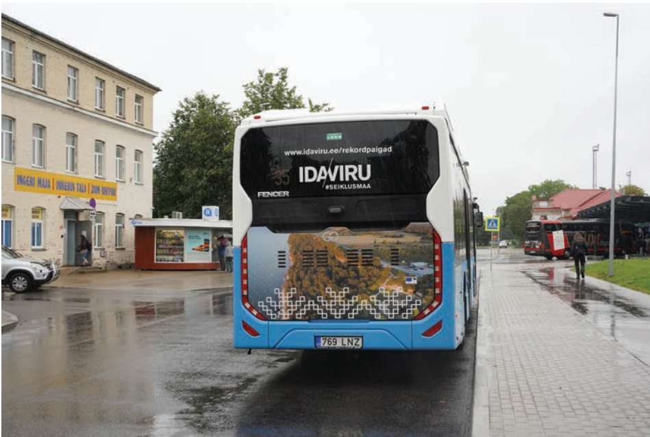
Joonis 1. Turismiklastri kampaania kohalikel bussidel, 30. august 2022.

21. sajand on olnud tunnistajaks Narva Kreenholmi tekstiilitööstuse hääbumisele ning Euroopa rohelepe hakul seisab ka põlevkivitööstus silmitsi põhimõttelise kahanemisega. Isegi kui energiakriisi valguses on kaevandusmahud ajutiselt suurenenud, ei lase 2020. aastate alguse kriiside konjunktuur – COVID-19 pandeemia, Vene agressioon Ukrainas ja hoogustuv kliimamuutus ning rahva reaktsioonid nendele – olukorral energiatööstuses stabiliseeruda. Tööstuse ümberstruktureerimine on vältimatu.