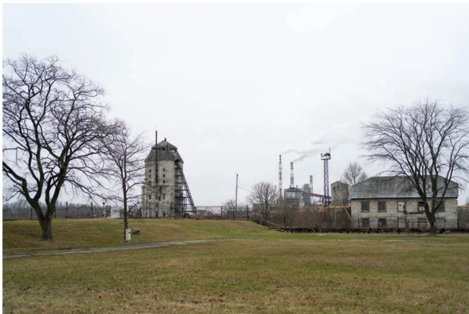
Joonis 7. Kasutusest välja jäänud õlitorn, mida on mõeldud muuseumina kasutusele võtta, kuid selleni pole jõutud, 5. detsember 2020.

2003; Printsman 2014). Üle saja-aastase ajalooa põlevkivitootmine jätkub Ida-Virumaal veel mõnda aega, kuid oma aja ära elanud alapid ja elemente saab käigusoleva tööstuse kõrval taas elustada.