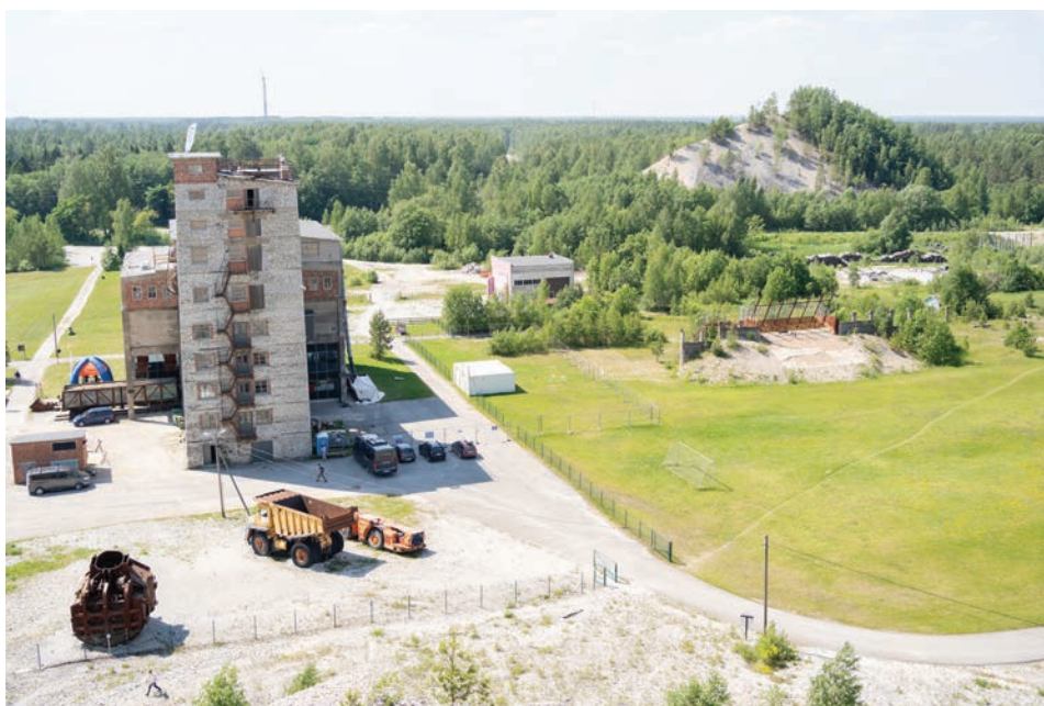
Joonis 6. Eesti Kaevandusmuuseum Kohtla kaevanduse (1937–2001) aladel, 19. juuni 2021.

See, mida võib-olla kohalik inimene ütleb, et issand kui kole see on, siis filmitegija ütleb, et jumal tänatud, et teil ei ole kõik korda tehtud, jumal tänatud, teil on seda kooruvat värvi seintel siin, ja seda teistsugust maastikku. Käisime siin ühe Ameerika filmiprodutsendiga, kes ütles, et kuulge, kogu teie maakond on nagu filmipaviljon – iga 12 km või 20 km tagant on uus ajastu uue arhitektuuriga. Järgmine linn – järgmine ajastu. Sul on [need] nii lähedalt väikeste vahemaadega võtta – ühelt poolt on sul Kuremäe klooster, sul on metsas lendoravad, siis sul on Sillamäe, siis Narva, siis Kiviõli – ehk erinevad ajastud ja kõik siinsamas võtta. Ma arvan, et kui meie filmifondi portfelli natuke paksemaks läheb ja siia erinevaid filme juurde tuleb, siis saab hakata ka filmiturismi välja mängima. Praegu see lihtsalt võtab natukene aega. Aga ma ise näen küll, et see on selgelt tuleviku teema. (Intervjuu 14.09.2021)