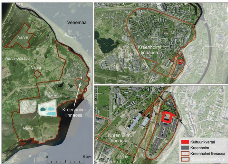
Joonis 3. Kreenholm (aluskaart: Maa-amet 2022).

ühenduslülisid – tööstuspärandi kasutamine turismis. Lähtudes ideest, mille järgi saab maastikku tervikuna käsitleda tööstuspärandina, oleme lisaks põlevkivitööstusele uurimise alla võtnud ruumiliselt ja sotsiaalselt samuti märkimisväärse tekstiilitööstuse. Tekstiilitööstus võttis oma hiilgeaegadel enda alla Narva Kreenholmi saare (joonis 3) ja tinglikult pool samanimelist linnaosa; põlevkivitööstus laiutab üle maakonna (vt joonis 2). Empiirilise materjalina toome sisse Ida-Virumaa tööstuskomplekside juures kanda kinnitanud ning kohalikul ja riiklikul tasandil silma paistvate ettevõtete ja organisatsioonide esindajate kommentaarid, mis aitavad pöörata tähelepanu ebakõladele tööstus(pärandi)turismi kohta käivate riikliku tasandi soovitude ja tegelike võimaluste vahel.