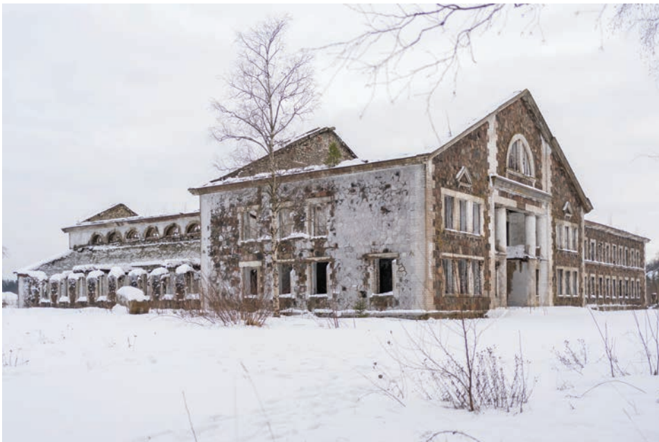
Joonis 4. Sompa kaevanduse (1948–1999) peahoone (1946–1948) – ehitismälestis, 23. jaanuar 2021.

Lähenetud on ka projektipõhiselt. 2017–2019 võtsid Kurzeme, Riia ja Vidzeme planeerimisregioonid koostöös MTÜ Lääne-Eesti Turismi ja SA Valgamaa Arenguagentuuriga Interregi programmi kuuluva Eesti-Läti koostööprojekti ESTLAT7 “Tööstuspärandi taaselustamine turismi arendamiseks” (“Revival of Industrial Heritage for Tourism Development (Industrial Heritage)”)² raames ette tööstuspärandi turismi eesmärkidel kaardistamise ja süstematiseerimise, jaotades objektid viide kategooriasse: veskid, raudteepärand, tehased, tule- ja veetornid. Nõukogude ajast libisetakse elegantselt üle, põhiorhk on “algupärasel”. Osalejate nimekiri selgitab projekti tulemusi: Harju maakonnast on esindatud vaid Ellamaa elektrijaam ja Telliskivi loomelinnak Tallinnas, Lääne-Virumaalt Kunda tsemendimuuseum ja Ida-Virumaalt Eesti Kaevandusmuuseum ja Kreenholmi Manufaktuur, kusjuures kõik eelmainitud objektid on küll punkti ja koordinaatidega ära märgitud, kuid sisuliselt avamata.