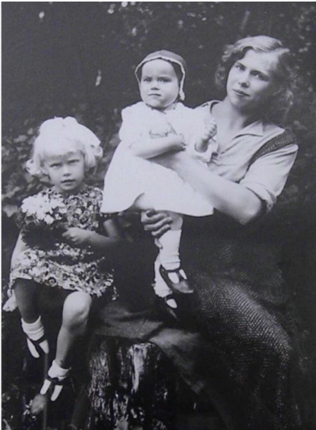
Pilt 1. Perepilt on tehtud aastal 1936.

Uurimise all olevad kirjad on ema ja õe poolt adresseeritud vanemale õele, kes need säilitas (vt pilt 1). Kirjad on leidnud tema poeg suvekodust, mille asukohal puuduvad seosed kirjades kajastatud asukohtadega. Kirjad anti uurimiseks üle ühele artikli autoritest ja need tagastati omanikule pärast kirjade läbitöötamist. Kirju on kokku 208, pooled neist kirjutatud ema, pooled noorema õe poolt. Artikli jaoks on pere anonümiseeritud.