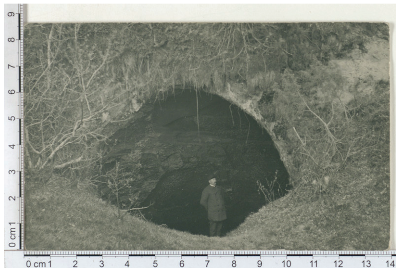
Foto 6. Maimu koobas Polli Mäkkiste talu maa pääl. Karksi põrgutare. Autor ja aasta teadmata. Eesti Rahva Muuseumi foto.