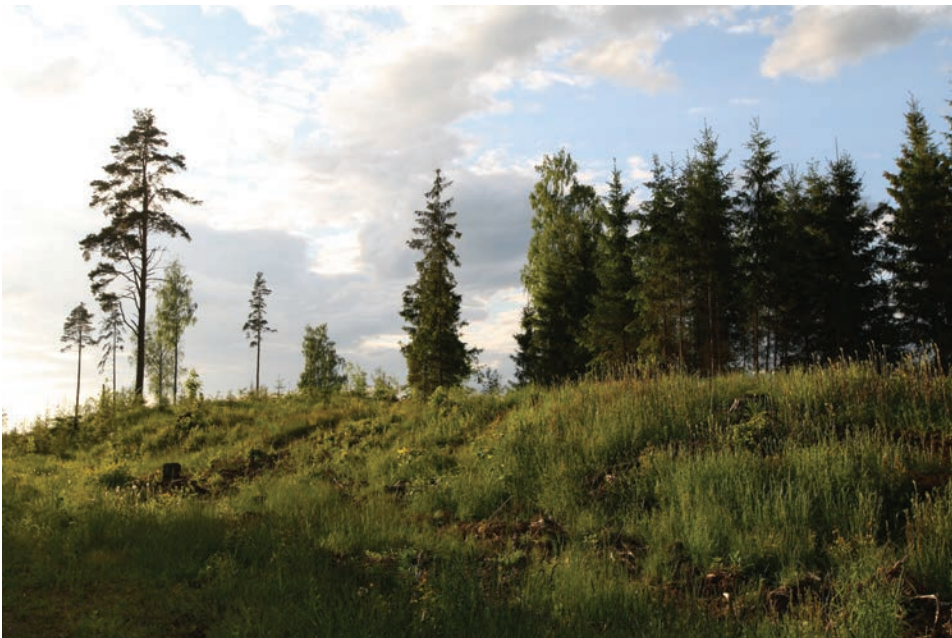
Foto 3. Vaade Tindi kalmele. Lähiminevikus on kalmel teostatud raiet. Laura Mäemetsa foto 2021.

Jaan Jung on kalmet ohvrikohaks pidanud, talu maadelt on leitud pronkskirves ning sealt läinud vanasti läbi ka palktee (Jung 1898: 27–38). Talu põllult on 1948. aastal künnitöö käigus leitud peaehe (Kiudsoo & Ratas 2005: 114). Ehkki Tindi talu ja selle maade puhul on ajalooliselt tegemist küll tuntud pärimusrohke paigaga, pole ükski objekt kaitse all. Tindi piirkonda ohustab uue kruusakarjääri rajamine. Nii kalme, ohvrikivi kui ka kirikuoru asukoht on praeguseni maastikus leitavad ning kalme vähemalt koduloolaste seas tuntud.