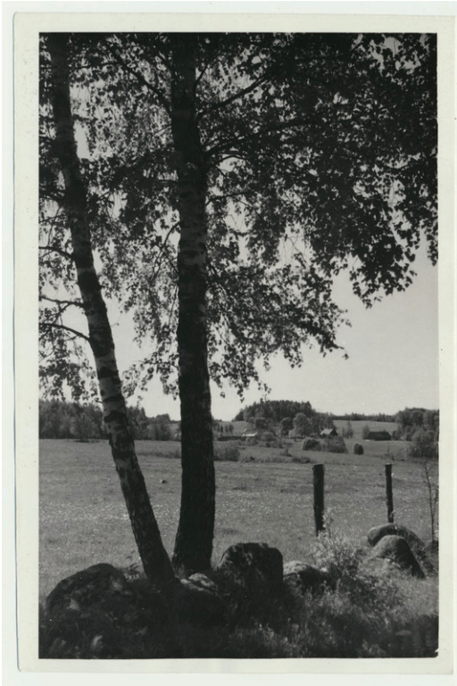
Foto 2. Mäeküla maastik. Eemal keskel Pähnamägi. 1964. aastal. Arhiiviteateid on kohast vähemalt üle 30, mis viitab paiga olulisusele kohalike seas. Ka on Pähnamäel kunagi asunud Pähnariba ehk arvatavad pühad puud. Kõrgeim tipp ehk Pähnamägi on künklikust Mäeküla maastikust kaevetegevuse tõttu hävinud.

Eelnevad näited esindavad ilmekalt mitmeid stereotüüpseid väljendeid Karksi kihelkonnast kogutud pärimuses, mis on kandunud läbi aja üsna muutumatul kujul ja esinevad lihtsustatud, lakooniliste teadetenäidetena veel eelmise sajandi teisest poolest pärit aineses.