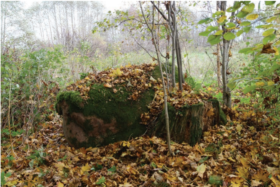
Foto 11. Toosi talu roosakast graniidist ohvrikivi, mille küljel kuivanud kuusekänd.

vaid paar pehastunud juppi, pisemaid kive hakkas silma mõni. Ka tamm, mida Valk veel 1995. aastal oli kirjeldanud kui täies elujõus puud, oli hävinud, püsti seisis vaid kuivanud tüügas. Võib öelda, et pühapaigast polnud säilinud enam midagi. Või oli siiski? Maastik, ehkki inimtegevusest tugevalt mõjutatud, oli alles. Kui pühapaiga olemasolu määratlemisel lähtuda sellest, et pühapaiga säilimise eelduseks on pinnas (Kaasik 2009: 35), võib paika pidada sellegipoolest mitte hävinuks, vaid allesolevaks. Koht illustreerib pühapaikade uurimise problemaatikat nii hävinud/alles skaalal hindamisel kui ka inimõjuse tegurist lähtumisel – kategoriseerimine on niivõrd tundliku nähtuse kui pühapaik puhul alati komplitseeritud, ainuõigeid lähenemisviise nähtavasti polegi.