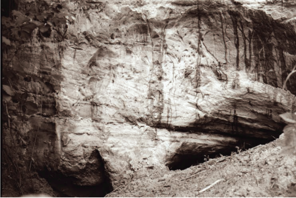
Foto 8. Karksi põrguhaud. Karksi (06.1960–07.1960). Lilia Briedise foto. ERA, Foto 4761.