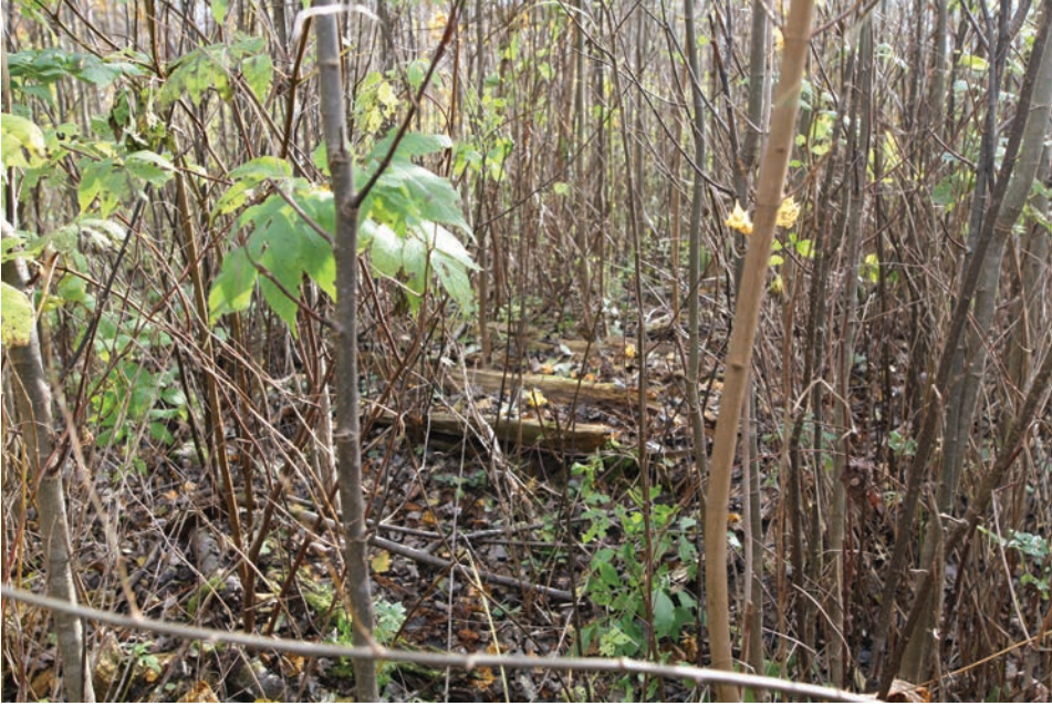
Foto 12. Toosi talu võsastunud Pel'eaed ehk riismed kunagisest pühapaigast. Laura Mäemetsa foto 2021.

Et nii maastikule kui pärimusele on omane dünaamilisus, on paratamatult muutunud mitmed Karksi paigad ühes neist rääkivate lugudega. Kõiki pühapaiku mõjutab suulise traditsiooni edasikandumine, kollektiivse mälu olemasolu ning selle elujõulisus, mis võib nii mõnigi kord olla primaarseks ning isegi ainsaks eelduseks koha säilimisel ja kaitsel.