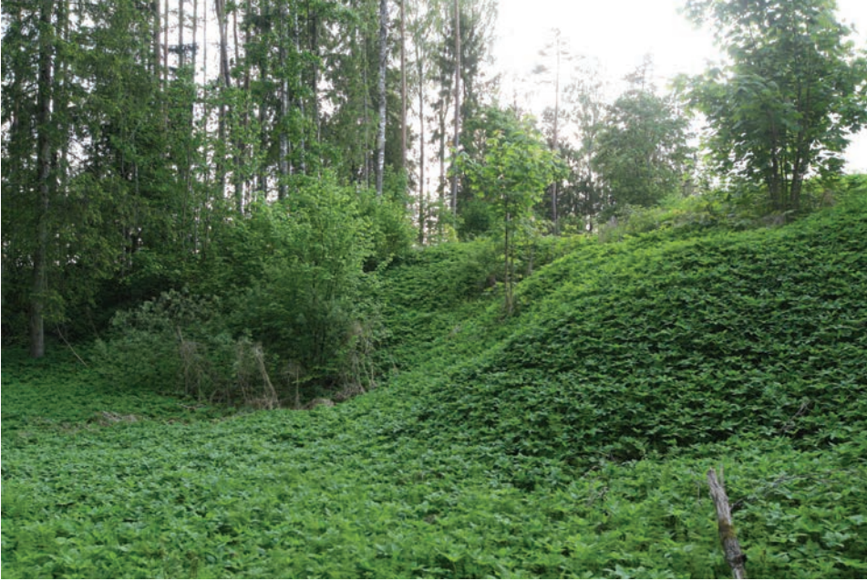
Foto 4. Orgu Tindil on nimetatud nii Mustlas- kui ka Kirikuoruks.