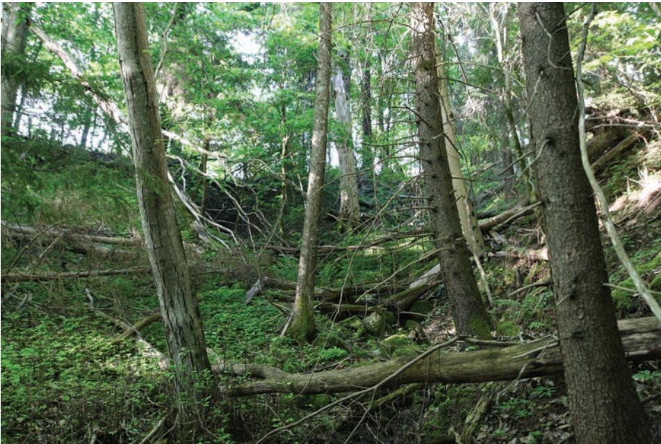
Foto 9. Võimalik põrguhaua ja allika koht Karksi linnusevaremetest lõunas. Laura Mäemetsa foto 2021.