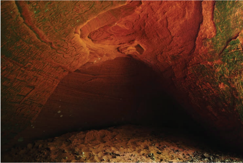
Foto 5. Mägiste põrguhauas.

Haua enda kohta pühapaigale viitav pärimus puudub, ravimisfunktsiooni on omistatud vaid allikale.