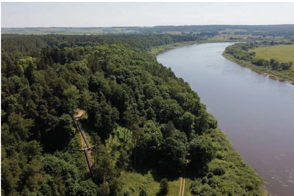
Foto 1. Rambynase mägi läänest.