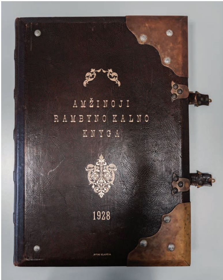
Foto 3. Rambynase igavese raamatu kaas. Andrius Kaniava foto 2022.

Rambynase raamatu tähtsust Jankuse silmis. Teiseks oli tähenduslik raamatu nimetuses sisalduv sõna “igavene”, mille eesmärk oli näidata raamatu olulisust tulevikus. “Rambynase raamatusse” sissekannete tegemine oli vastutusrikas ülesanne – oli see ju mõeldud igavesti kestma. Raamatut hoitakse hetkel Leedu Rahvusraamatukogu Martynas Mažvydase arhiivis, selle koopia on aga tähtsal kohal Rambynase lähedal asuva Bitėnai muuseumi püsiekspositsioonis.