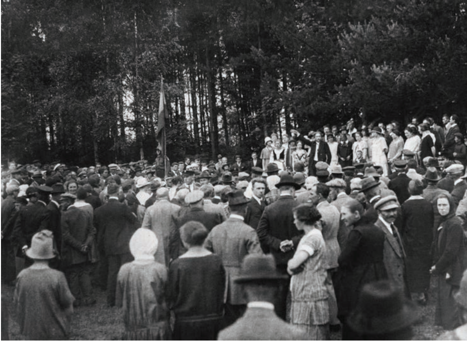
Foto 4. Suvise pööripäeva tähistamine Rambynases 23. juunil 1925.