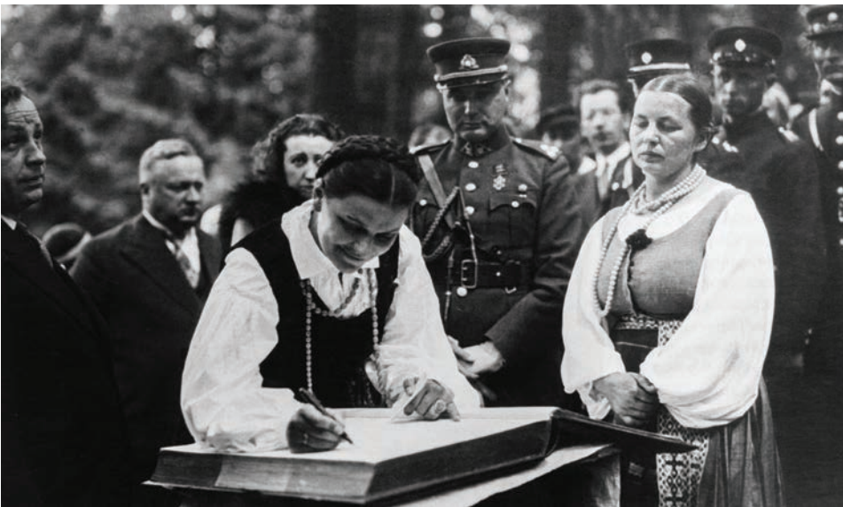
Foto 5. Identifitseerimata naine tegemas sissekannet Rambynase raamatusse 1934. aastal.

Rambynase raamatut lugedes on tähelepanuväärne, kui üldsõnalised on mõned sissekanded. Ehk muutus igavikulisuse tegur rõhuvaks isegi Vydūnase, tolleaegse kultuurilise ja poliitilise liikumise juhi ja ilmselt kõigi aegade populaarseima preisi-leedulase jaoks. Aastate jooksul tegi ta Rambynase raamatusse mitmeid sissekandeid, mis kõik on esimesega sarnased: “Õitsegu Leedu rahvas kõiges, mis on hea, ilus, tark, õiglane ja tugev!” (Rambynase raamat, 24. juuni 1928). Hoolimata sellest, et mõte on suurepärane ja inspireeriv, näib sõnum ise üldsõnaline ega kajasta isiklikku kogemust. 1932. aastal avaldab Vydūnas oma sissekandes Rambynasest ka isiklikumaid tundeid: “On erakordne jälgida, kuidas jõgi, org ja künkad justkui mähitakse tihedasse udusse. Näib, nagu udu hajudes kerkiks esile midagi kaugest minevikust. Ja näib, nagu udu tihenedes kaoks terve maailm taas unustusse. Selline vaatepilt avaneb tavaliselt õhtuti Rambynase otsast” (Vydūnas 2001: 99–100). Teiste Rambynase raamatusse jäetud üldiste loosungite asemel rõhutab Vydūnas oma 1932. aastal kirjutatud raamatu “Seitse sajandit Saksa-Leedu suhteid” selles lõigus just paiga tunnet ja õhustikku.