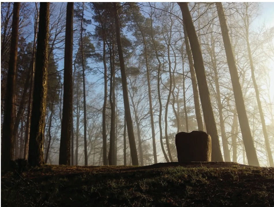
Foto 2. Tänapäevane ohvrikivi, mis paigaldati Rambynase mäele hävinud kultuskivi asemel. Andrius Kaniava foto 2016.