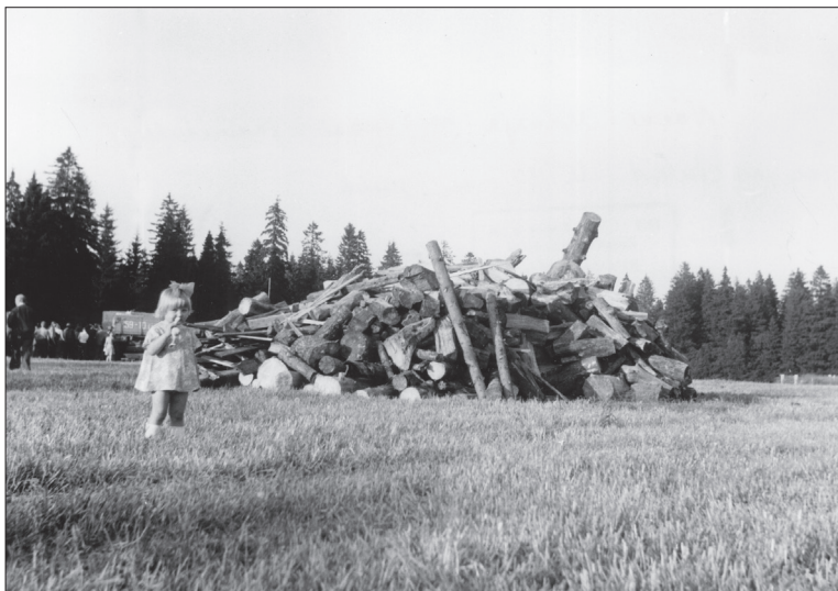
Foto 3. Ühisjaanituleks on kuhjatud üle 30 m puid. Väike-Maarja khh. Foto Mall Hiemäe 1979. ERA, Foto 12407.

Tuntumate kogunemiskohtade seas on nimetatud Vaivara kihelkonna Sinimäge, Narva jõe äärset Olgina mäge, Jõhvi kihelkonnas oli tuli Ontikal paepeelsel mererannikul, Edivere linnamäel ja Kuremäe vaatetorni juures, Iisaku kihelkonnas Koldamäel, Vaiklas jõeäärsel platsil ja Tudulinna linnamäel, Viru-Jaagupi kihelkonnas kiriku taga kaasikus, Väike-Maarja kihelkonnas Punamäel, Kadrina kihelkonnas Kallukse kiigemäel. Lüganuse kihelkonnas Aa rannas süüdati tuli rannavallil, kust olnud mereäärsed tuled näha kuni Viru-Nigula kihelkonna Letipea neemeni, üle mere paistnud isegi Tütarsaare tuli. Jaanitulelt ei hoidnud kõrvale ka härrasrahvas: Püssi krahv käskinud tule teha pargi aia taha, Kiltsi härra lossi lähedale veski juurde, Mõdriku härra lasknud moonakal lõkkepuid hobusega mäele vedada, Palmse krahvi korraldusel paugutatud koguni kahurit ning mindud lossijärvele sõudma. Kiigeplat-sidele ehitati tantsupõrandaid, mõnel pool seati üles värvilisi laternaide ning postide ümber vanikuid. Ringmängud ning mõisajaanituledel propageeritud jõu- ja osavusmängud vahetas ajapikku välja koorilaul, pillimäng ja paaristants. Tantse on informandid nimetanud tosina jagu: polka, valss, labajalg, viruvalss, viru mage , ringitants e perekonna-valss, leilender , opsaa , tustep , krakuljak , padispaan , vingerka .