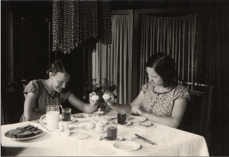
Foto 2. Lihavõttemunade kõksimine, Kadrina hkk. Foto Richard Viidebaum 1933. ERA, Foto 217.

Paastumaarjapäevast punajoomistki on Jõhvi kihelkonnas nimetatud lüpsikute turbutamiseks, samuti nimetati jaanipäevast Kaarli kõrtsis käimist Rakvere kihelkonna Raudlepa külas, kuid kõige suuremaks pidutsemispäevaks kujunes Ida-Virumaal venepärase naistepüha eeskujul ikkagi jüripäev. Ühe naistepeol osalenu jutustuse järgi küpsetasid Kauksi küla naised kaasavõtmiseks mitut seltsi pirukaid ning kogunesid oma kompsude ja korvidega kokkulepitud peresse, kus oli rohkem ruumi. Kui naiste seltskonda sattus meesterahvas, tõsteti ta üles. Kes viina ostis või raha andis, võeti kampa. Pill mängis, naised tantsisid. Samuti pidutseti Kuru külas, koos olid abielunaised ja mõned tüdrukud, õhtuks tulid ka mehed seda nalja vaatama (1962). Sälliku külas jutustas 84aastane naine 1962. aastal, et vanad naised küll käivad veel koos, kuid noored enam mitte.