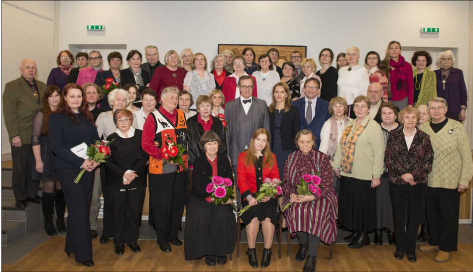
Fotol rahvaluulekogujad ja kirjandusmuuseumi töötajad koos Eesti Vabariigi presidendi Toomas Hendrik Ilvese ja proua Ieva Ilvesega.