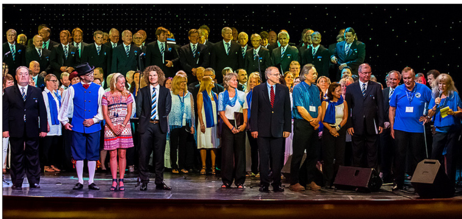
Välis-estlaste 2015. aasta kultuuripeo "Üle ilma" lõppkontserdi tänuhetk. Iivi Zajedova foto 2015.