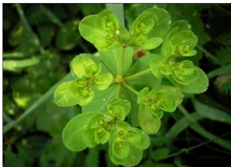
Foto 1. Hariliku piimalille nn piim on Eestis teada-tuntud nahahaiguste vastane vahend.

Soolatüüka vasta oli see hein, mis põllu pial kasvab ja valge piim tuleb tal välja. Vat nime ei mäleta. Meie kandis teda ei ole. Tolle piimaga tehti kokku ja siis kadus ära. (RKM II 413, 511/2 (5) < Rõngu khk, Härjanurme k < Puhja khk, Nasja k – Eda Kalmre < Elli Purm, 67 a (1988).)