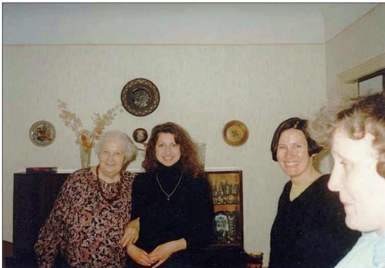
Foto 3. Üks majaomanikke koos lapselapse ja uurimisrühma liikmetega. Mära Zirnite foto 1996.

seerinud karjääri ja omandanud teatud majandusliku tasakaalu, kuigi majaanitus on toimunud hüpoteegiga tagatud krediidi abil ja on seega seotud teatud rahaliste raskustega, mis intervjuerimisel meenuvad mõlemal maja praegusel omanikul.