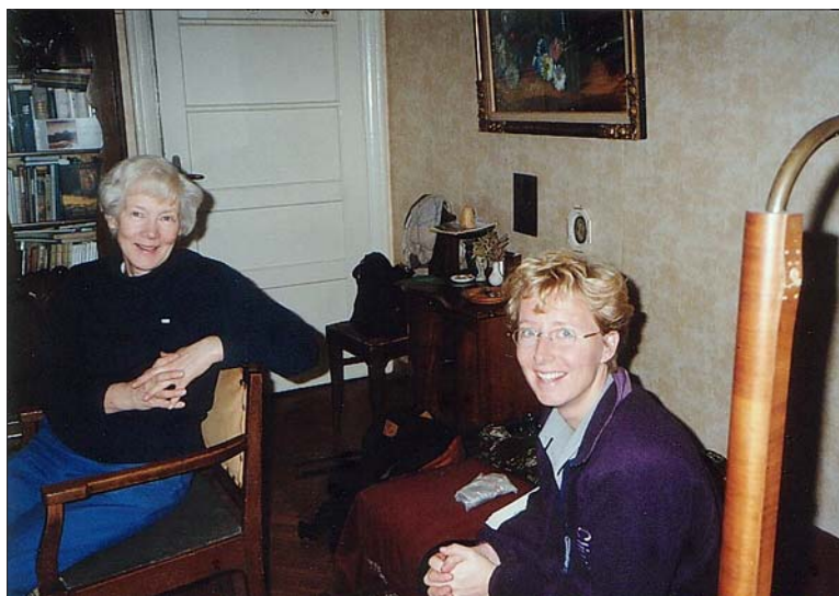
Foto 2. Üks majaomanikke koos külalisega Hollandist. Māra Zirņīte foto 1996.

Vaadeldav maja on tüüpiline Riia 20. sajandi kolmekümnendate aastate üürile antavate korteritega elamu. Ka maja omanike elukäik sarnaneb paljude selleaegsete Riia elanike saatustega. Kaks noort juristi ehitavad hüpoteegilaenu abil maja, et nende peredel, kus kasvavad väikesed lapsed, oleks tulevikus kindlustatud alaline elukoht – oma kodu. Omanikud on loonud pere, stabiili-