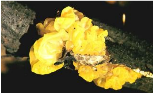
Mõnedki limaseene liigid arenevad vaid väga niiske ilmaga. Üks ilusamaid on Tremella