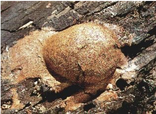
Rahvauskumuste järgi võib puugipask palju kahju tekitada

Puugipasa leidmisega on seotud erinevad kujutelmad. Esimeses järjekorras nimetatagu uskumust, et kui puugi või krati kõht vara (piima) vedades liiga täis saab, siis ta jätab endast maha jälje, puugipasa (Loorits 1949: 296). Tavaliselt põletati see ära (ERA II 188, 323(74) < Käina khk., Nõmme k. - E. Ennist (1938), mille tagajärjena usuti puugikskäijal juhtuvat mingi õnnetus, näiteks tekkisid tal seedehäired vm. Hädast lahtisaamiseks pidi viimane oma ohvri käest midagi saama, sageli sööki (ERA II 168, 43(1) < Mustjala khk., Järise k.- A. Toomesalu (1937); E 77380(17) < Jämaja khk. - A. Kuldsaar (1931).