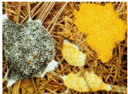
Puugipask ( Fuligo septica ) on eriti silmatorkav vihmajärgsetel päevadel

Märkimisväärse koha eesti usundis on hõivanud limaseen Fuligo septica , mida on seostatud puugi või koguni nõiaga. Tegemist on maailma suurima limaseenega, mille viljakeha võib kasvada üle 30 cm suureks (Kastanje 1995: 48). Rahvasuus tuntakse teda (eelkõige Läänemaal ja Saaremaal) puugipasa , puugisita , harva nõiapasa , aga paikkonniti ka raganasita või -pasa (peamiselt Häädemeeste ümbruses), harvem lehmasisita (Saaremaal), koerajäti (Kihnus), kratisita (Hiiumaal ja Kihnus), päärapasa (Läänemaal ja Hiiumaal), peera-pasa , muugasita nimetuse all. Sageli on ta kollane, kuid esineb ka teisi toone, sagedamini valget, mõne teate järgi ka halli ja punast. Värvus ei varieeru siiski nii palju kui pilvepala puhul.