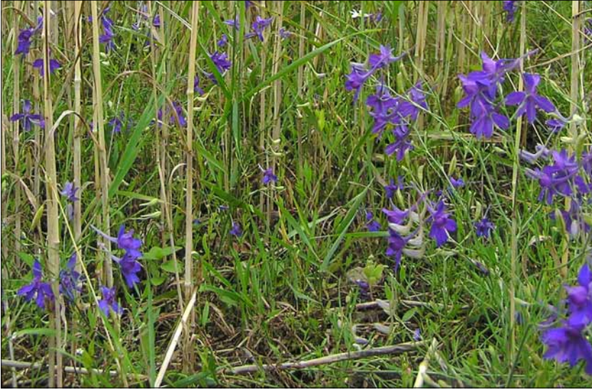
Foto 1. Pölvaresjalale on iseloomulikud küüne- või kannusekujulised õied, millest on tulnud ka rahvapärased nimetused kulliküüned, kukekannused jt. Kasvukohta ja õie värvuse järgi on teda nimetatud ka rukkisinililleks, rukkisiniseks jne.

vastab nendele tingimustele. Analüüsi ja kõrvutuste tulemusena on HERBA täienenud mitme seose võrra: rukkisinised ja kulliküüned on juurde saanud seose põlvaresjalaga ning lisandunud on uus rahvapärane taimenimetus rukkisinililled , mille ainuvasteks on põlvaresjal; allikaks on kolm eespool toodud teksti HERBAST.