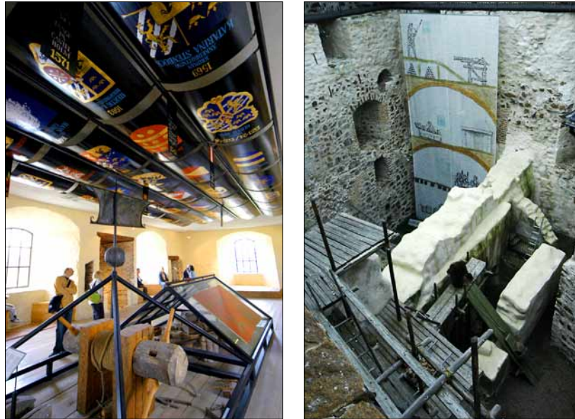
Fotod 7 ja 8. Kastelholmi lossi sisevaated jätavad hoonest veel võimsama mulje kui välisvaade. Juuli 2005. Alar Madissoni fotod.

taas kord, et kui mängus on võimujagamine, ei tunne vend vennaarmu.