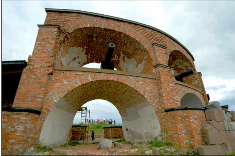
Foto 19. Bomarsundi merekindlus, mis päris valmis ei jõudnudki saada, on leidnud oma koha turismiobjektina: siin korraldatakse igal aastal vene päevi. Juuli 2005.

tal oli 5000 sõdalast mahutav kindlus kasutusvalmis. Lõplik valmimine oli kavandatud 1875. aastaks. Kuid päris valmis ehitised ei saanudki – näiteks peakindluse kõrvale kavandatud 12 kaitsetornist jõuti ehitada vaid kolm –, sest vahele tuli Krimmi sõda. 1854. aastal ründasid prantslased ja inglased Bomarsundi nii raevukalt, et 16. augustil heisati varemeteks muudetud kindluses allaandmise märgiks valge lipp. Et Pariisi rahu kohustas Venemaad Ahvenamaad neutraalseks alaks muutma, Bomarsundi kindlust enam ei taastatudki.