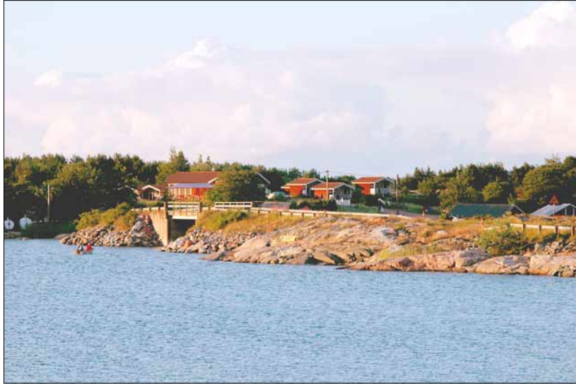
Foto 21. Turism kui üks peamisi majandusharusid sunnib ahvenamaalasi leidma lahendusi, kuidas säilitada omapärase ja puutumatu loodusega ning keskkonnasäästlikku elulaadi säilitava paiga mulje, pakkudes samas huvireisijatele kõigiti tänapäevaseid majutusvõimalusi koos magamistoa aknast avaneva miljonikroonivaatega. Juuli 2005.

Saartel pole lihtsalt võimalik ära kaduda, sest iga nurga tagant vaatab välja järjekordne teeviit: muinashaua juurde 1,3 km, keskaegse kirikuni 5 km ja telkimisplatsini 3 km. Peaaegu igas külas on mõni kohalik avanud muuseumi. Kui aga isegi tagasihoidliku koduloomuuseumi jaoks ainet pole jätkunud, on midagi muud vahvat välja mõeldud – nagu teosafari, millest eespool juttu oli, või veinitalu.