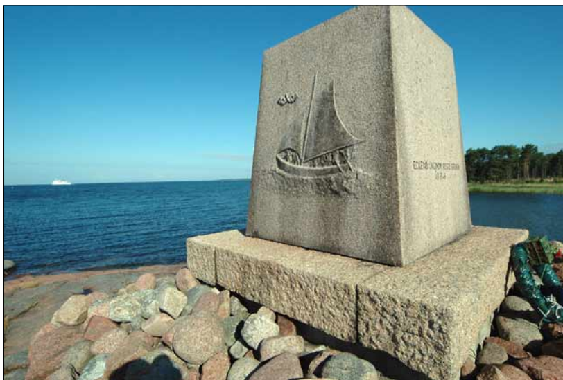
Foto 20. Merel hukkunud postivedajate mälestuskivi Hullvikis. Juuli 2005.

Ahvenamaalased teavad täpselt, et nende sissetulek tuleb turistide taskust. Sellepärast on tehtud ka kõik, et turistil oleks hea olla.