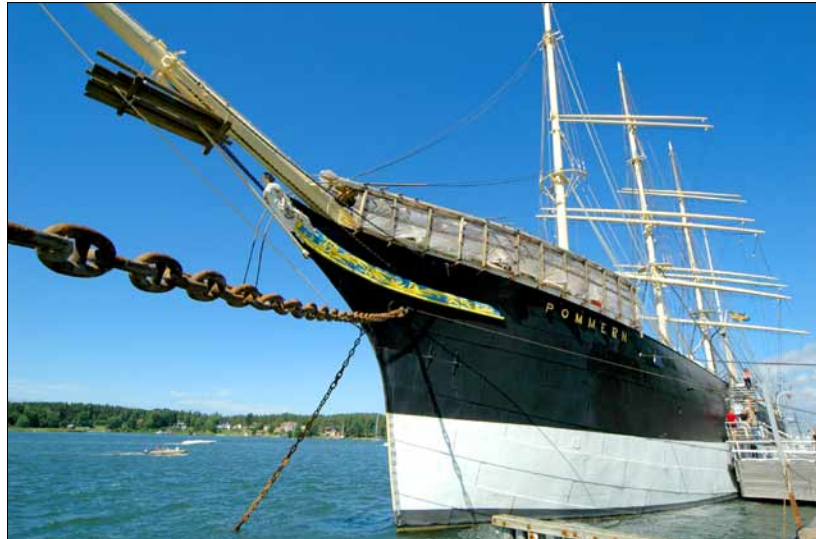
Foto 5. Muuseumlaev Pommern – neljamastiline ookeanipurjekas – on juba 1939. aastast ankrus Mariehamni Läänesadamas. Juuli 2005.

all Teise maailmasõja eelõhtul 1939. aastal ja on sellest ajast saadik seisnud ankrus Mariehamnis. 1947. aastal surnud reederi pärijad kinkisid purjelaeva 1952. aastal Mariehamni linnale. Dokumentaalfilmi Pommerni viimasest merereisist Hullist kodusadamasse on muuseumlaeva külastajatel võimalus vaadata permanentse seansina. Eksponaatide hulka kuuluvad ajaloolised merendusega seotud esemed alates signaallippudest ja lõpetades autentsete lauanõudega kapteni kajutis – kõik, mis vähegi tutvustab 20. sajandi alguse meremeeste eluolu.