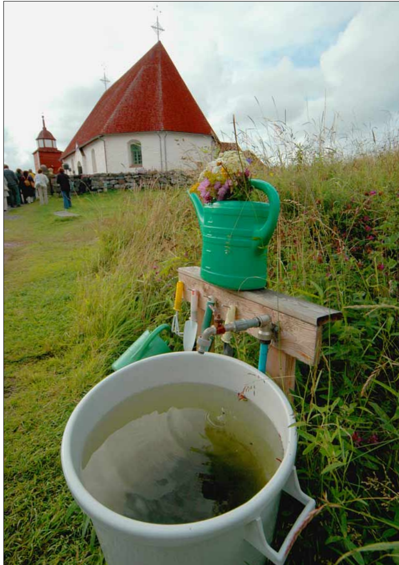
Foto 16. Ahvenemaal on 16 maalilist kirikut. Kõkari Püha Anna kirik ei asu keset küla, vaid selle loodeotsas, Hamnö saarekesel. Selle kõrval on 13. sajandil rajatud frantsiskaani kloostri kabeli vare ja rannal võrratud punased kaljud. Juuli 2005.