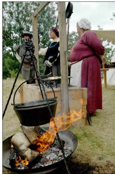
Foto 10 ja 11. Rüütliturniirid (vasakul) ja kohalikke hõrgutisi küpsetavad stiilsed pannkoogikokad (paremal) on Gustav Vasa päevade lahutamatud kaaslased. Turistidele müüakse ju ajalugu ja omapära. Juuli 2005.