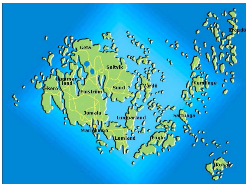
Joonis 1. Ahvenamaa saari ja laide ei jõua keegi kokku lugeda ega kaardile kanda – meri on neid täis niisama tihedalt nagu saarte maapind kive ( www.eurotourism.com/aland ).

Kui Soome Vabariigi poeetiline sünonüüm on tuhande järve maa, siis üht tema lääni, Soome ja Rootsi vahel Balti meres Botnia lahe lõunaosas paiknevat Ahvenamaad (rootsikeelse nimega Åland) võib julgesti nimetada tuhandete saarte maaks, sest igas mõõdus saari ja skääre ehk kividest koosnevaid kaljusaarekesi on seal 6757 ja neid tekib pidevalt juurde. Taas ja taas kerkib kivikuhilaid keset merd ja ongi uus skäär sündinud.