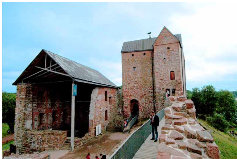
Foto 6. Kastelholmi loss, Ahvenamaa ainus keskaegne kindlus on olnud Rootsi kuningatele nii residents kui ka vangla. Juuli 2005.

Lossiga on seotud hulk pärimusi Rootsi kroonitud peadest ja teistest kuulsustest. Sellejuures on jahti pidanud kuningas Gustav I Vasa (12.05.1496–29.09.1560; valitses 1523–1560), siinses vanglas istus ka poolvendade poolt troonilt kukutatuna tema poeg, oma kroonimispäeval Rootsi aadliseisused asutanud ja Liivi sõja päevil Eestitki valitsenud kuningas Erik XIV (13.12.1533–26.02.1577; valitses 1560–1568) ja siin laskis poolvend Johan III (20.12.1537–17.11.1592; valitses 1568–1592) kostitada teda kurikuulsa mürgitatud hernesuuga, mis Eriku eluküünla kustutas. Enne seda oli aga ka seesama Johan viibinud Kastelholmis Erik XIV vangina. See näitab