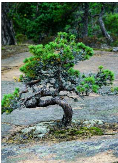
Foto 2. Looduse ikebana – kidur puuke kaljul. Juuli 2005.

Esindatud on ka selline eksootiline põllumajandusharu, mida oleme rohkem harjunud seostama Prantsusmaaga – viinamäetigude Helix Aspersa kasvatamine. Teofarm on rohkem küll turistimagnetiks mõeldud ja külaskäik sinna teosafariks nimetatud, sest pä-