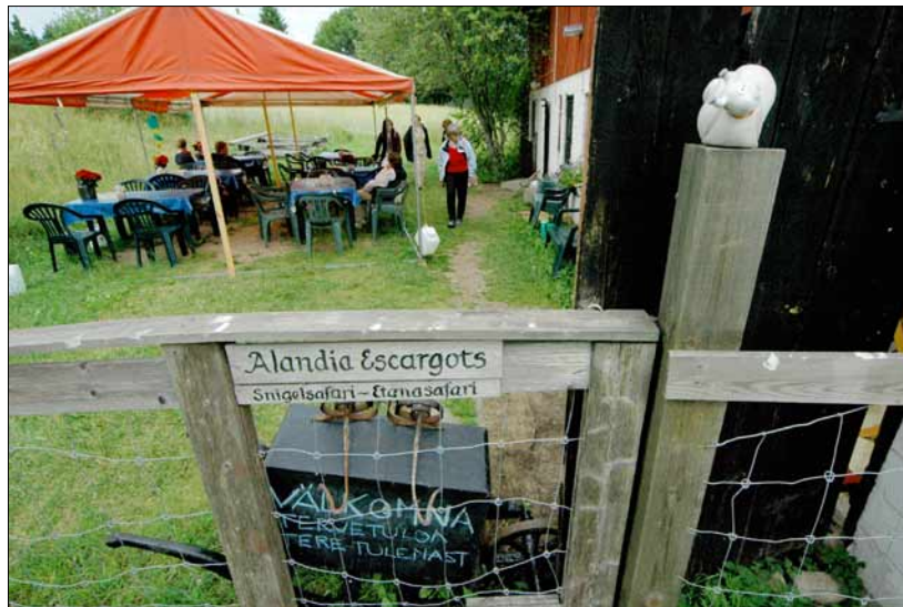
Foto 3. Teofarm on üks Ahvenamaa turismiobjekte. Väraval ootavad külalastajaid teoskulptuurid ja mitmes keeles teretulemast-tervitused, varikatuse all aga saab maitsta tigudest valmistatud delikatesse. Juuli 2005.

rast väikest ekskursiooni tigude kasvatamise hoonesse, kus võib näha, kuidas loomakesed oma igapäevasel teosammul edasi liiguvad, on külastajal soovi korral võimalik ka degusteerida väga maitstvas kastmes kuumtöödeldud teokest serveerituna miniatuurses teokarbikujulises keraamilises vormis. Selle delikatessi eest tuleb välja käia 5 eurot.