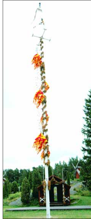
Fotod 12 ja 13. Jan Karlsgardeni vabaõhumuuseumis püüavad pilku rootsipunased tuulikud ja kõrge jaanisammus ehk meilupuu. Juuli 2005.

suveniire Ahvenamaal üldse oli aga postkaart kohaliku leiva retseptiga.