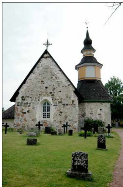
Fotod 17 ja 18. Hoopis eripäraseid elamusi pakub frantsiskaanlaste rajatud Kumlinge Püha Anna kirik (paremal), mis meenutab oma 15. sajandist pärinevate freskodega (vasakul) tõttu Vahemeremaade sakraalehitisi. Juuli 2005.

Erandlik sakraalehtis on Kumlinge Püha Anna kirik, mille rajasid frantsiskaanlased ja mis on kuulus oma ainulaadsete 15. sajandist pärinevate freskodega ning meenutab seetõttu vanu Vahemeremaade kirikuid.