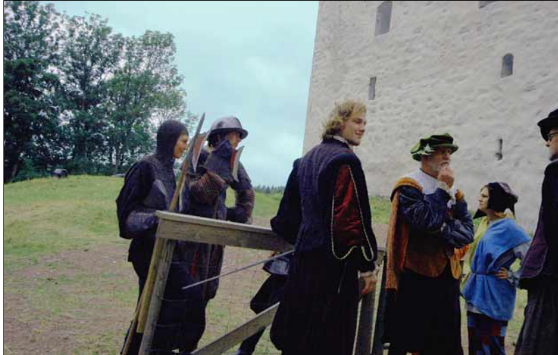
Foto 9. Kastelholmi loss on ideaalne kuliss keskaja lavastamiseks. Gustav Vasa päevad viivadki Rootsi esikuninga aegadesse. Juuli 2005.

maa ka Poola trooni valitsenud dünastia rajaja mälestust au sees hoiab.