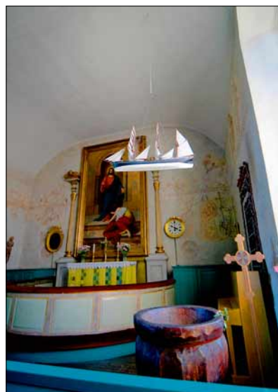
Fotod 14 ja 15. Ahvenamaa kirikute eripära on saareelanike muistsele tegevusele viitav laes rippuv purjelaevamudel, asugu see pühakoda siis Kökaril või Mariehamnis. Juuli 2005.