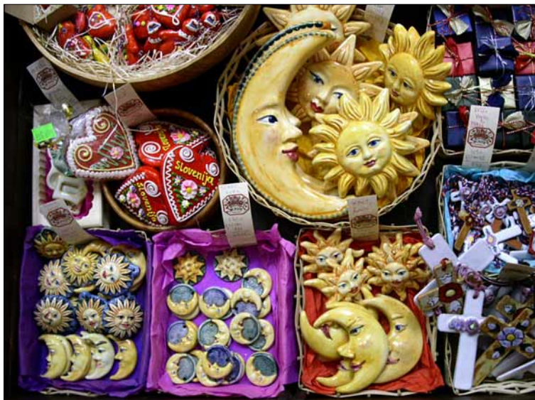
Etnogalerii Skrina sisaldab vaimukat, naljakat, tõsist, õnnetoovat.