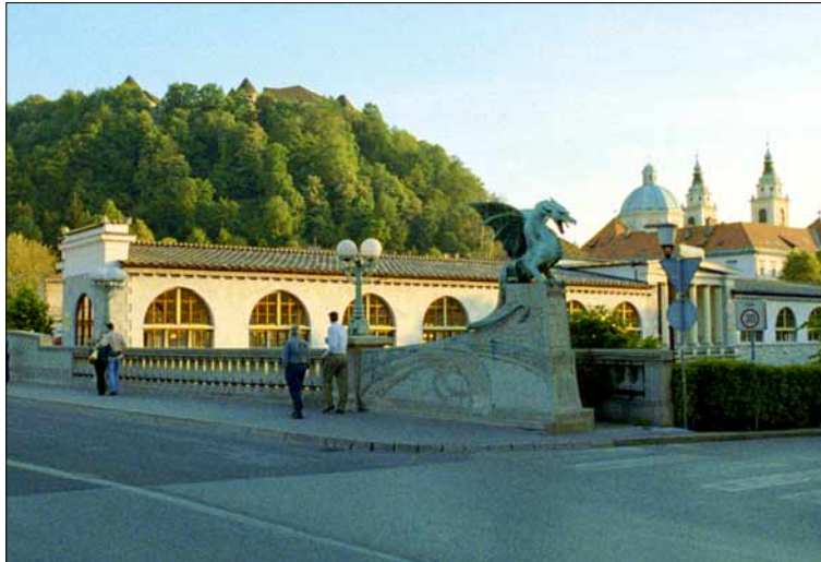
Ljubljana tunnuseks on lohed, mida leiab linna erinevates paikades. Sillalohed on neist kuulsaimad.