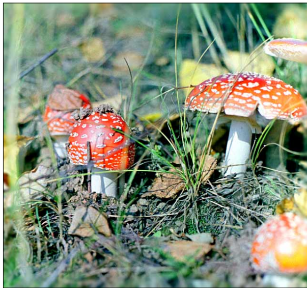
Punane kärbseseen.

Euroopas teatakse hallutsinogeensetest seentest peamiselt vaid punast kärbseseent. Kuivõrd aga kärbseseene tarvitamisel on tugevad kõrvalmõjud, on mõned autorid oletanud, et siinsed muistsed šamaanid kasutasid ehk rohkem hoopis Psilocybe perekonna seeni.