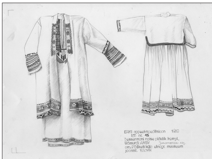
ERKI oppaekspeitsioon 1980 100 nr. 45 besermian riise pidulik kompl. Udmurti ANSV Jukaemenski raj. om. Põõketi küla etnogr. muuseum joonist. VÄRVIK

Комплект бесермянской женской праздничной одежды из коллекции Пышкетского сельского музея. Юкаменский район Удмуртии. Учебная экспедиция Эстонской академии искусств. Рисунок: Вийви Аавик 1999. ERM EJ 557:24.