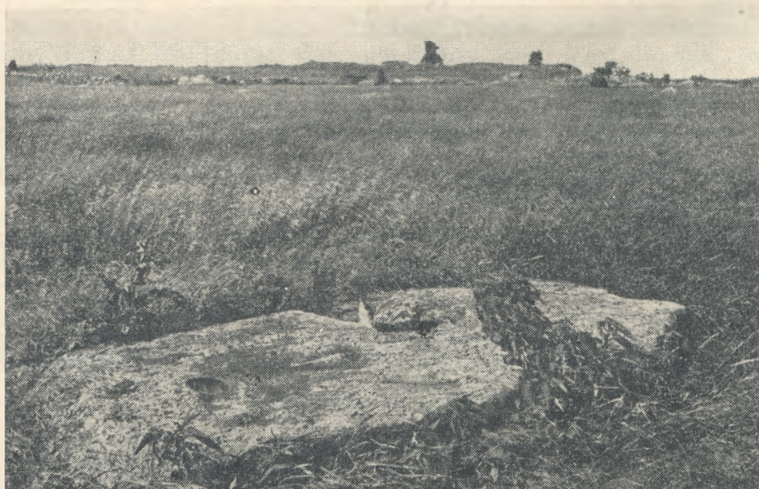
Vanapagana või Tõllu varbajäljega kivi Suure-Rootsi külas.