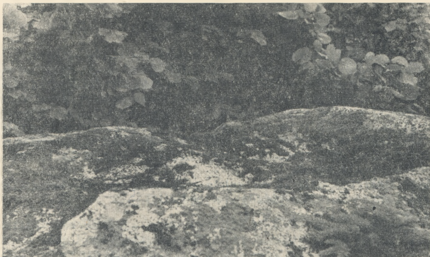
Vanapagana või Tõllu istmease kivil Kihelkonna alevi ligidal.