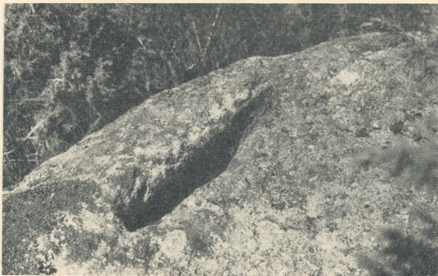
Tõllu noole jälg kivis Kehilas. E. Veskisaare foto 1958.