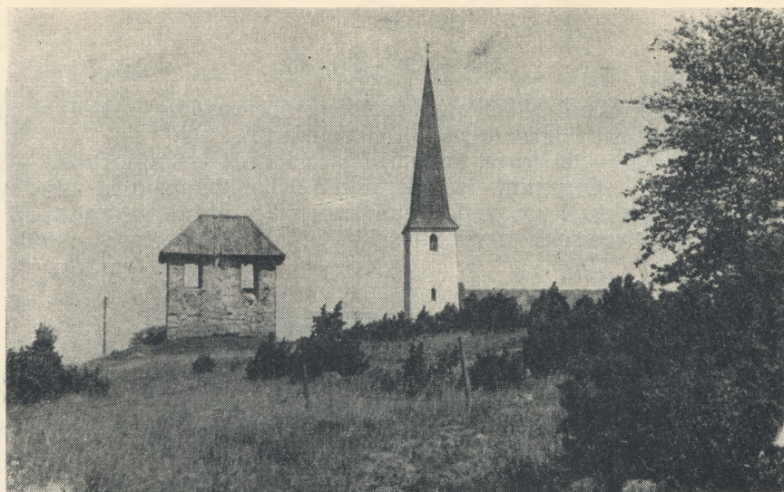
Kihelkonna kirik ja kellatorn.

kiriku ukse ette, muist. 18, 19; Kivi Kaarma kiriku ukse ette, muist. 17, 39; Kivi Kaarma kiriku pihta, muist. 129 D; Kaarma kiriku ehitamine, muist. 128—130, 132, 150, 162 B; vrd. veel HVM I, lk. 360—361, muist. 324; samuti: Vasarapildumine, Petseri vägimees, muist. 1.