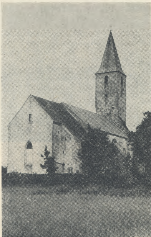
Kärla kirik. 1959.

ERA II 231, 651 (6) < Kaarma, Kaarma-Suur v., Irase k. — M. Kokk < Ivan Kokk, 54 a. (1939).