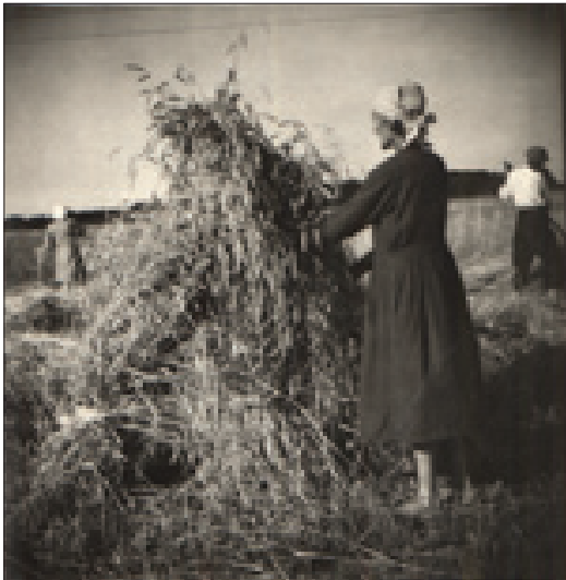
Foto 1. Rukkilõikus lauritsapäeval Jõhvi khk Kohtla k. Foto Endel Mets 1949. ERA, Foto 2267.

Iisaku ja Vaivara khk lõunaosa eestistunud külades see komme kodunenud pole.