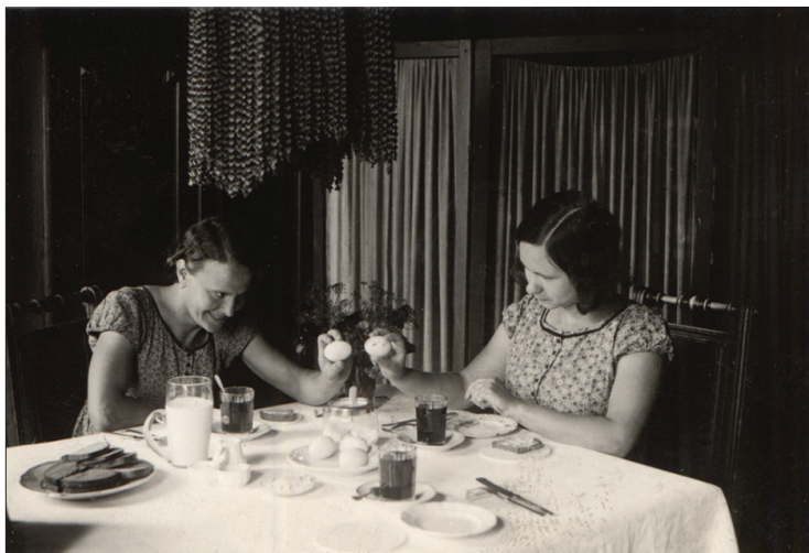
Foto 2. Lihavõttemunade kõksimine, Kadrina hkk. Foto Richard Viidebaum 1933. ERA, Foto 217.

Paastumaarjapäevast punajoomistki on Jõhvi kihelkonnas nimetatud lüpsikute turbutamiseks, samuti nimetati jaanipäevast Kaarli kõrtsis käimist Rakvere kihelkonna Raudlepa külas, kuid kõige suuremaks pidutsemispäevaks kujunes Ida-Virumaal venepärase naistepüha eeskujul ikkagi jüripäev. Ühe naistepeol osalenu jutustuse järgi küpsetasid Kauksi küla naised kaasavõtmiseks mitut seltsi pirukaid ning kogunesid oma kompsude ja korvidega kokkulepitud peresse, kus oli rohkem ruumi. Kui naiste seltskonda sattus meesterahvas, tõsteti ta üles. Kes viina ostis või raha andis, võeti kampa. Pill mängis, naised tantsisid. Samuti pidutseti Kuru külas, koos olid abielunaised ja mõned tüdrukud, õhtuks tulid ka mehed seda nalja vaatama (1962). Sälliku külas jutustas 84aastane naine 1962. aastal, et vanad naised küll käivad veel koos, kuid noored enam mitte.