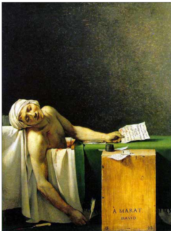
Foto 1. Jacques Louis David (1748–1825). Marat' surm (1793; õli, lõuend). Repro.

tetraloogia (vt nt Updike 1995 – toim) peategelase viimseid sõnad – lausunud pärast 1500 lehekülge kestnud ootamist ja oma banaalsuses ületamatud – All I can tell you is, it isn't so bad ( Kõik, mis ma võin teile öelda, on, et see ei ole nii hull ) kui küüniline kokkuvõtte ameerikalikust kultuurist jõuavad kunagi samasugusesse lentsõna staatusse.