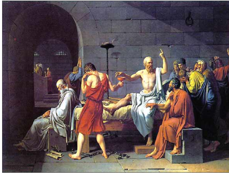
Foto 3. Jacques Louis David (1748–1825). Sokratese surm (1787; õli, lõuend).