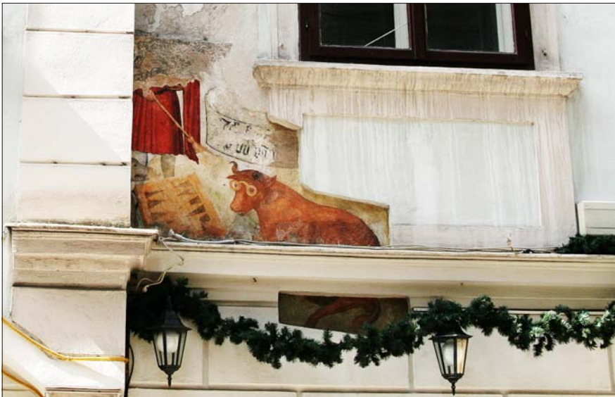
Foto 2. Hunt ja Härg mängivad, härjal on väga võidurõõmus nägu. Vahur Kuperjanovi foto 2008.

16. sajandi algupoolel oli Martin Lutheri algatatud protestantism haaranud Viini täielikult. See ei meeldinud Ferdinand I-le, kes kutsus 1551. aastal jesuiidid korda majja looma ja taastama katoliiklust. Peaaegu sada aastat kestnud verine sõda lõppes 1648. aastal Vestfaali rahuga. Ning sellel freskol sümboliseerib härg katoliiklust ja hunt protestantlust. Ja backgammoni mäng kujutab peaaegu 100-aastast sõdimist ( http://www.virtualvienna.net/columns/billie , viimati kontrollitud 2008. aastal, praeguseks seda lugu enam sealt lugeda ei saa).