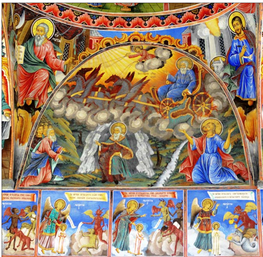
Foto 1. Eelija vanker Rila kloostri seinal Bulgaarias. Andres Kuperjanovi foto 2008.

Üheks võimalikuks algupäraks kaasaegsele sõnale sant on peetud ladina- keelset sõna sanctus st püha. Suure Vankri seos pühaku või prohvetiga on otseselt dokumenteeritud Sloveenias, seostatuna Toursi pühaku Martiniga. Ungarist on teada nimi Püha Peetruse Vanker, selle esmane fikseering päri- neb 16. sajandist romaani aladelt ja Venemaalt Kurski kubermangust on tea- da Taaveti Vanker. Üle Euroopa ja sealhulgas üsna jõuliselt ka eesti rahva- astronoomias on tuntud nimetus Eelija Vanker: