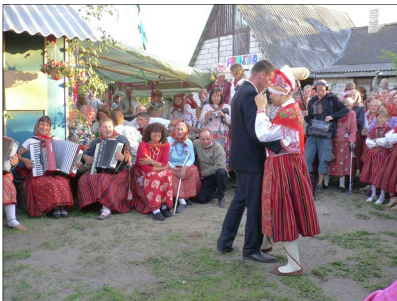
Foto 4. Noorik tantsib peiupoisiga.

Kihnu polka ja valss erinevad tavalisest. Polka käib ilma hüppamiseta, hoogsalt keerutades, harilikult valsivõttes. Tüdrukud ja noored naised hoiavad sageli üksteise ümbert kinni, mis võimaldab kiiremini keerutada. Osavamad tantsupaarid keerutavad ühe tuuri päripäeva, teise vastupäeva, samal ajal ikka ringis ühes suunas edasi liikudes. Valsil on kaks tuuri: kõnnituur ja valsiuur. Ka valss käib ringjoont mööda. Ilmselt kõnnituuri pärast kutsuti valssi vanasti ka käömälugu . Ka labajalal oli kõnnituur: Kui pää hakkab ringi käima, siis käiakse natuke aega kõrvuti ühekäevõttes kas kõnd- või hüppammudega (ERA