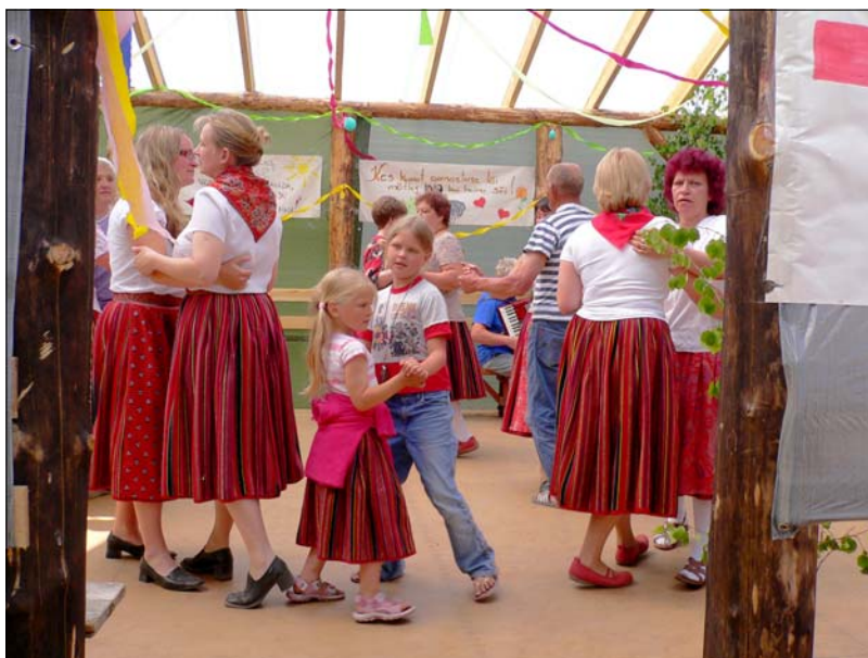
Foto 8. Tants pulmas. Kihnu valss.