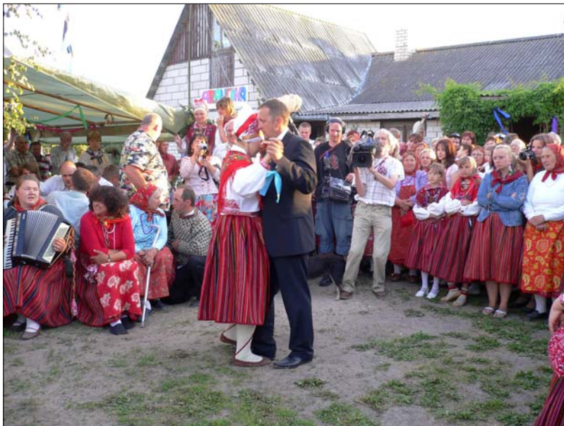
Foto 5. Noorik tantsib peiuga.