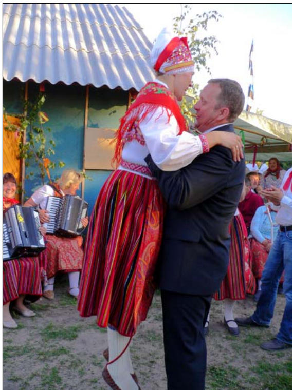
Foto 6. Peigmees tõstab tantsu lõppedes nooriku kolm korda üles. Ingrid Rütütlü foto 2007.