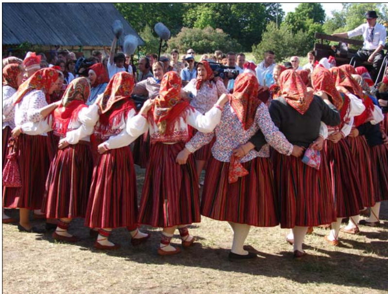
Foto 2. Laulmine rattas peiukodu õuel.