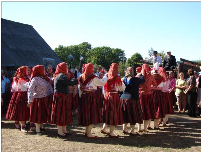
Foto 3. Sama, teine käteasend.