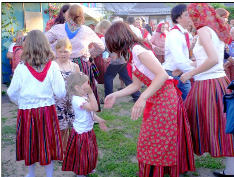
Foto 7. Tants pulmas. Kalamies.