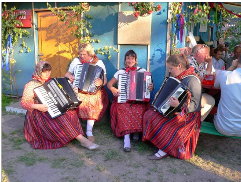
Foto 1. Pulma pillinaised.