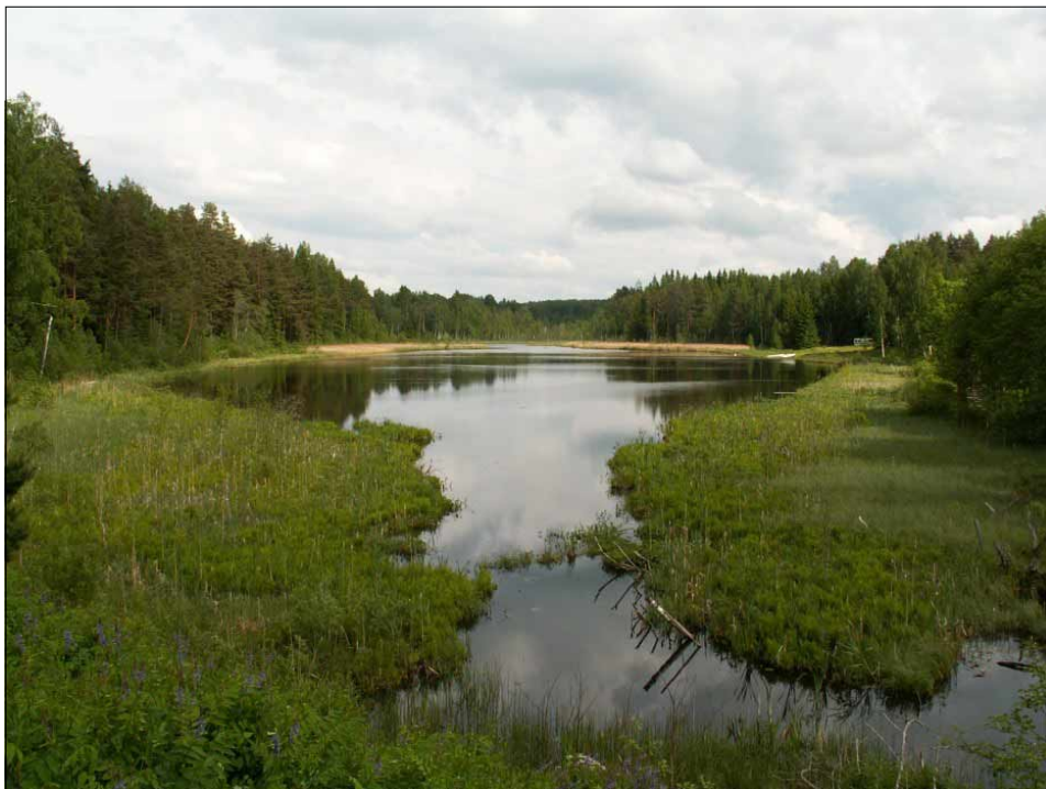
Foto 1. Rõngu Andresjärvi aastal 2005.