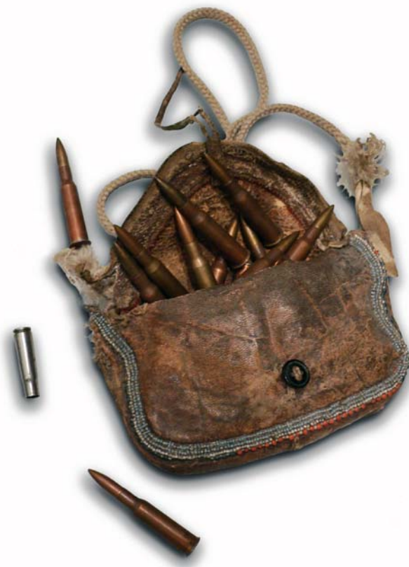
Joonis 1. Hülgenahast padrunikott.

Räägiti ka karu püüdmisest trossist silmuse abil. Selleks tehti pal- kidest püsttaraaedik, millesse jäeti meetrilaiune avaus. Avausse loo- ma pea liikumise kõrgusele asetati terastrossist silmus, mis seoti puu külge. Aedikusse pandi tünn roiskunud kalaga. Kalahaisu pea- le kohale tulnud karu sattus aedikusse sisenemisel silmusesse. Ha- kates rabelema ja jõuga terastrossi sikutama, lämmtas loom enda. Sellist püügivahendit ma oma silmaga ei näinud, aga sellest rääki- sid Vene piirivalvurid, kes seda püügiviisi kasutasid.