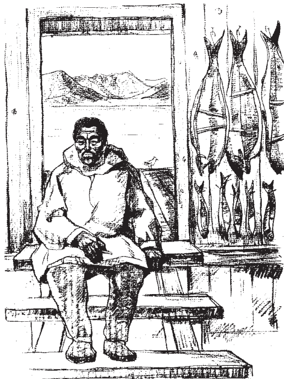
Joonis 6. Tšuktši kalur puhkehetkel (Andrejava & Gorbatšova 1990).

Toitumiseks on aga vähe aega, sest enne tormide algust tuleb alustada tagasiteed lõunasse, et pääseda üle mägede. Ees ootab neid 1200 km pikkune teekond, samad jõed, kust nad lõuna poole rännates üle tulid, karud ja muud ohud.