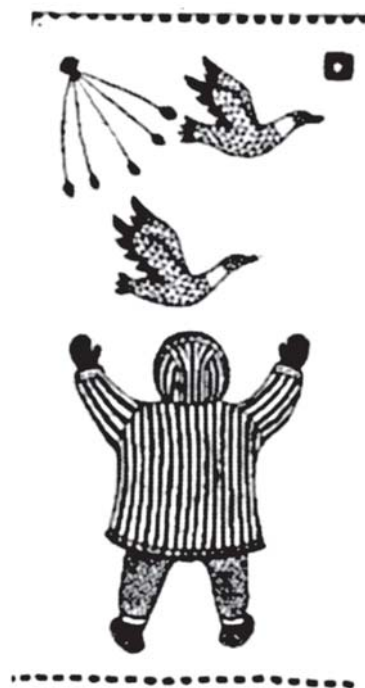
Joonis 2. Linnujaht eplökõtjega (Andrejeva & Gorbatšova 1990).

Jäneseid püüdsime jooksuradadele asetatud lõksude ja silmustega. Erilist saaki me ei saanud, sest panime püünised liialt küla lähedale ja aeg-ajalt oli keegi neid