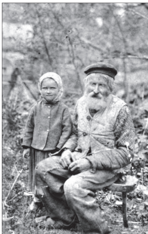
Foto 5. Kihnu laps ja taat.

Käisid ka Rootsis soola toomas ja igad kraami ja ka Saksas viina toomas. Vedasid puid ja raudkivisi Pärnu ja vahest ka Riiga. [---] Enne esimest ilmasõda Kihnu saarel kokku 65 laeva. Nii