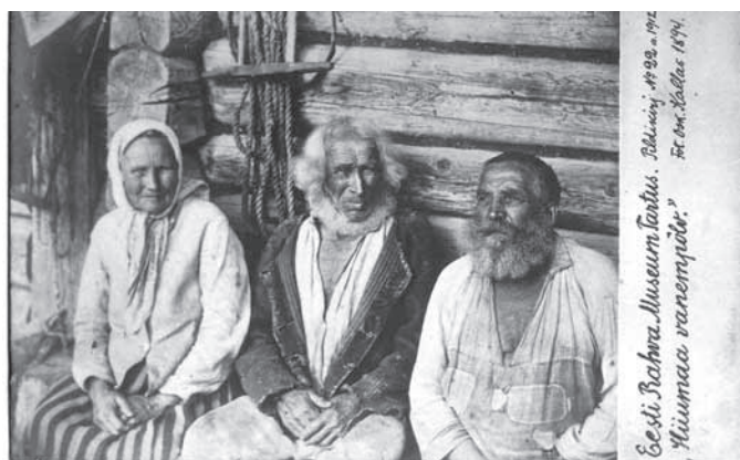
Foto 3. Vanema põlvkonna hiidlased. Hiiumaa muuseumi kogu (HM 4169).

Kuue all kanti vildsed särki. Särk kujudi vardaga, nagu nüüd kampsunid. Särgile tehti pääauk sisse, ja pandi selga üle pää. Viimase all oli linane särk (ERM EA 16, 486 – Erna Ariste (1932)).