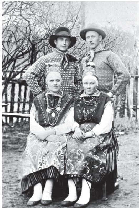
Foto 6. Kihnu rahvarõivais naised ja troides mehed.

Meremehed kihnlane ei pidanud maameest, põllumeest, enese vääriliseks ega põlluharimist meeste tööks. Isegi teisi randlasi, saarlasi, ei peetud meremeestena täisväärtuslikeks (Saar 1998: 143).