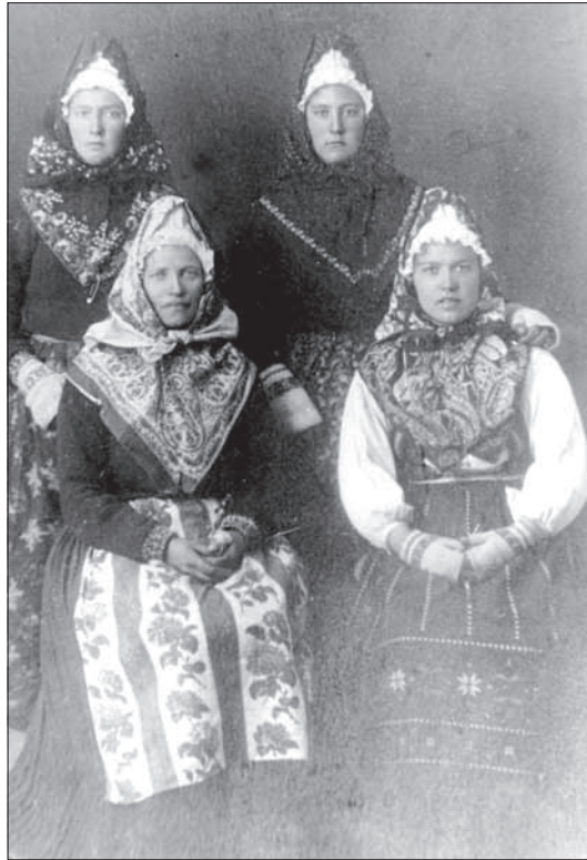
Foto 7. Ruhnu rahvarõivais naised, osa neist tumedate kampsunitega.

oli jahisaagi jäält kojutoomine, kui mehed ei jaksanud rikkalikult hülgejahilt naastes ise saaki külla vedada (Klein 1924: 216).