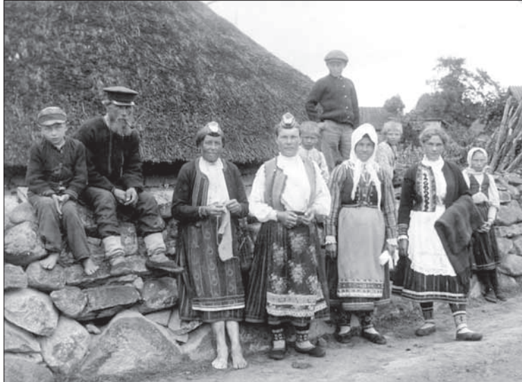
Foto 4. Silmkoekampsunitega täiendatud rahvarõivais muhulased (ERM 214: 166).

kaupmeeste külla ilmumist tütarde eest varjata, et vältida rahakulutamist (Laasberg 1998: 15).