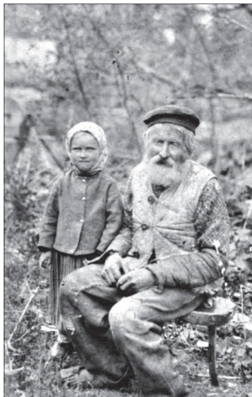
Foto 5. Kihnu laps ja taat.

Käisid ka Rootsis soola toomas ja igad kraami ja ka Saksas viina toomas. Vedasid puid ja raudkivisi Pärnu ja vahest ka Riiga. [---] Enne esimest ilmasõda Kihnu saarel kokku 65 laeva. Nii