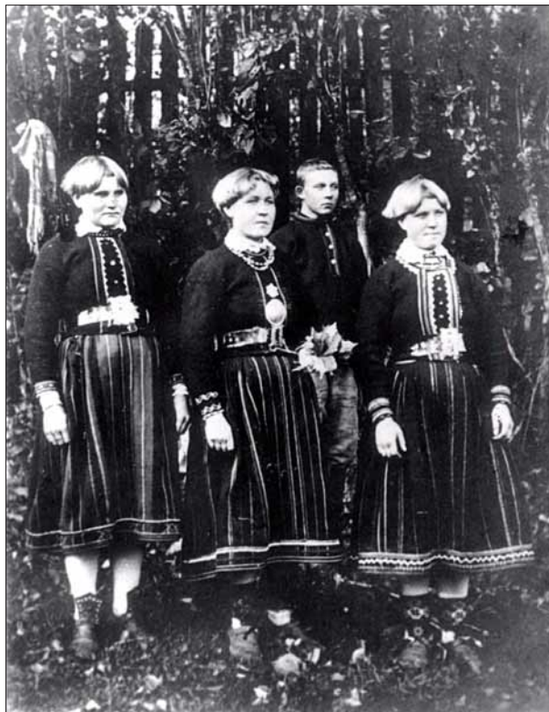
Foto 8. Muhi neiud rahvarõivais ja silmkoekampsunites.

Rõivastele ja naise käsitööoskustele esitatavad nõudmised olid ühelt poolt säästlikkus ja vastupidavus ning teiselt poolt vahelduse ja uudsusesoov. Mõeldes veel siinjuures inimese elu tähtsamate sünd-