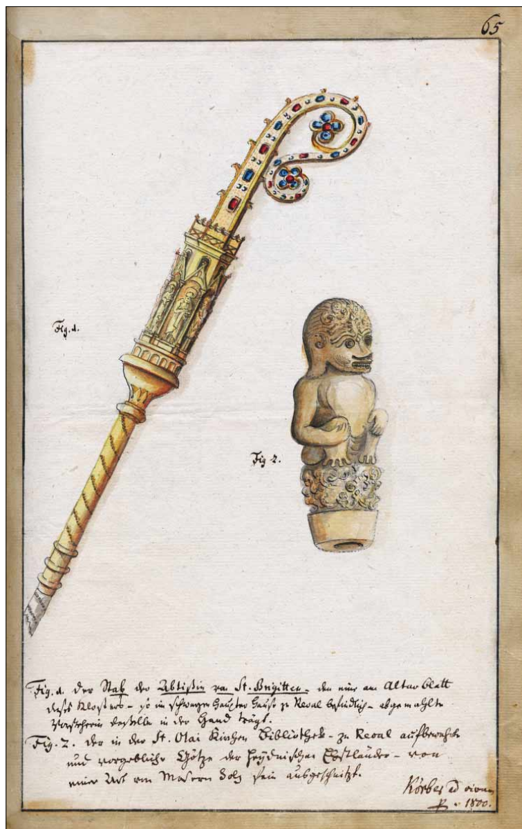
Joonis 2. Körberi joonistus (1800) oletatavast eestlaste jumalakujust, mille kohale on paigutatud kristlikku väge sümboliseeriv sau.