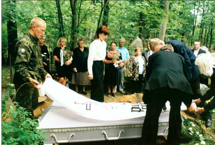
Foto 5. Matustel ei tohi ühegi tava vastu eksida. See käib ka surnukirstu lina või tekiga katmise kohta (pildil). 1999.

tagasi. On usutud ka vastupidist – tuul puhub õnne tagasi. Palju ennustusi on seotud surnu hauaga. Kui see enne surnu haudalaskmist varises, ennustati uusi surnuid. Üldlevinud eetiline nõue on, et matuserongi möödumisel peab töö seisma jätma, muidu toob see õnnetust. Tänapäeval kohati arvestatakse sellega – seisatatakse töö, jäädakse seisma (või jäetakse auto seisma), kuni matuselised mööduvad, ja võetakse peakate peast. Samas kurdavad aga informandid, et inimesed kipuvad kiiruse tõttu seda kommet unustama.