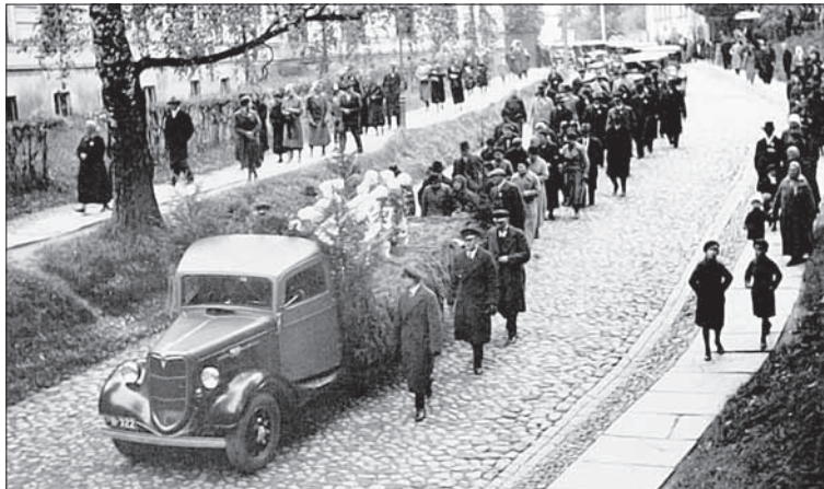
Foto 3. Autoga seotud surmaannetest senini teateid ei ole. Küll aga on tähelepanelikult jälgitud matuserongi. Matuserong Tartus Toomemäel 1930. aastatel.