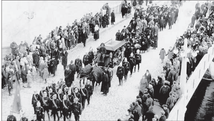
Foto 2. Surnuvankrit vedava hobuse käitumist jälgiti matustel tähelepanelikult – sellest võis välja lugeda surmaendeid. Tuletõrjuja matuserongkäik Tartus Vabadussillal 1931. aastal.