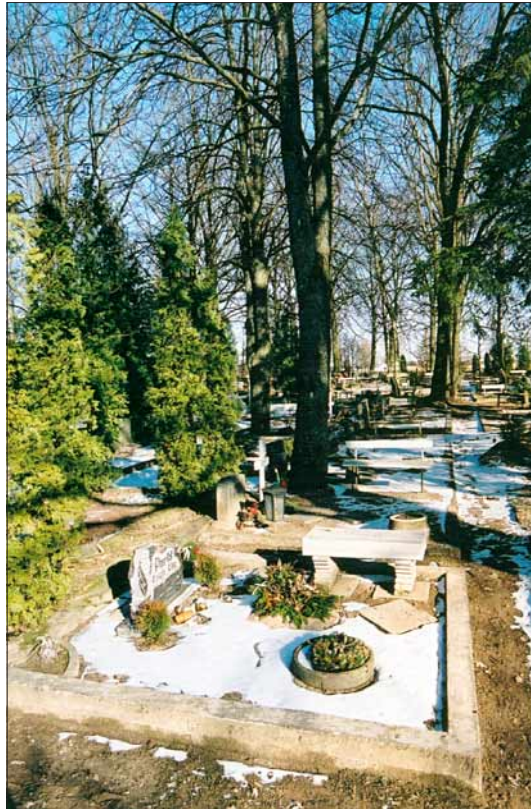
Foto 6. Surnuaialt ei tohi midagi kaasa võtta – arvatakse, et see toob õnnetust.

lahkus esimesena mees, pidi järgmine olema meessurnu, naise lahku- mise korral – naine (Loorits 1932b: 197). Peielaua puhul jälgiti, et kui laua katmisel nõud maha kukuvad, tähendab see surma. Saa- remaal ennustatakse järgmist surnut esimese söömahakkaja jär- gi. Jüris arvati, kes viimase matusteviina joob, see esimesena sureb.