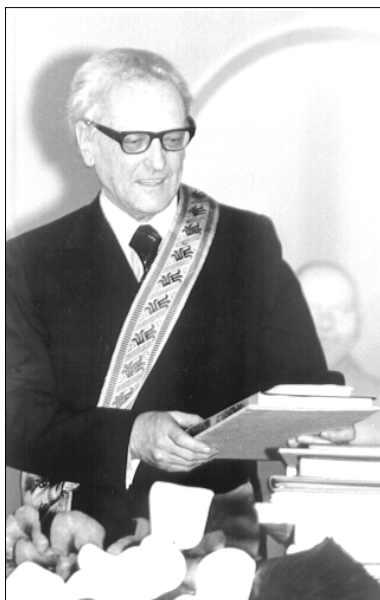
Akadeemik Paul Ariste oma 70. sünnipäeval 1975. aastal Tartus..

bitus aga ta elu lõpul üha enam konflikti. Ta ei saanud pensioni (see polnud Nõukogude kolhoosnike puhul erandlik), mistõttu ta suhe ametvõimudega oli seda olematum. Tütred ja väimehed ei sallinud tema vadja keeles kõnelemist, vanu pruuke, nendesse uskumist, laulmist ja naermist. Või nagu P. Ariste on kommenteerinud: Tütred tahtsid olla hästi peened (VE XXI: 110).