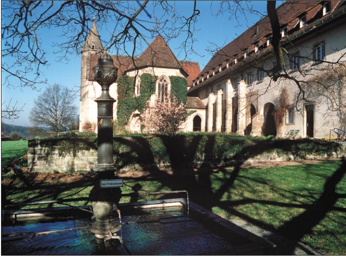
Joonis 2. Lorchi klooster: Pärimuse järgi asutasid kloostri 12. ja 13. sajandi vahetusel Švaabimaa hertsog Friedrich I ja tema kaasa, Saksa-Rooma keisri Heinrich IV tütar Agnes von Franken Staufide (Hohenstaufenite) matmispaigaks.

teostest leida ajaloolist tõe ja kaitsevad seda siis kangelaslikult nn teadlaste tsunfti tagakiusamise eest. 15