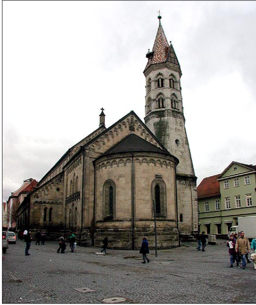
Joonis 1. Schwäbisch Gmündi Johannese kirik. See hilisromantismi sakraalarhitektuuri kaunis näide on ehitatud aastatel 1220–1250 kolmelöövilise sammubasiilikana varem samal kohal asunud kiriku vundamendijäänustele. Pikihoone kõrval kõrguv torn on Švaabimaa kauneimaid.