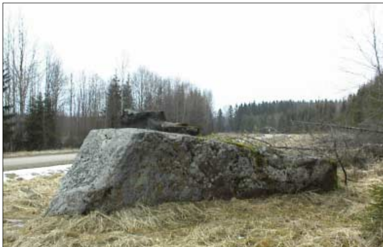
Joonis 3. Hobuserauaga kivi. Foto: Ain Kalda 2001.

Teateksjäämisel võib olla erinevaid põhjusi: konkreetse kivi kohta pole süželist juttu olnudki, informant vahendab lihtsalt oma tähelepanekuid ümbritseva suhtes; süžee on käibelt taandunud või informant ei soovi seda mingil põhjusel parajasti lisada. Kõik niisugused olukorrad on muistenditundmises, -levikus ja kogumistöös esindatud.