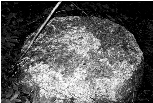
Joonis 1. Punktiga ring kivil Virunuka tarandkalmete läheduses Rõuge kihelkonnas. Kohalik rahvas peab piirikiviks. Alkeemias tähistab selline sümbol kulda. Miks sellel kivil leidub niisugune sümbol, ei tea.