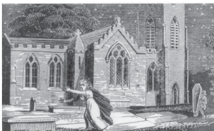
“Drychiolaeth”. Joonistus Hugh Hugesi raamatust “Yr Hynafion Cymreig” (Carmathen, 1823).

1978. aastast saadik on nii uelsi kui inglise keeles välja antud arvukalt selleteemalisi raamatuid, mis osutab, et usk vaimudesse on endiselt püsiv. 57 Noorte inimeste huvi paraseansside vastu paistab olevat siiani suur ning auto- ja raketiajastul on autojuhtid tihti teatanud ebamaistest nägemustest öistel sõitudel. Tüüpiline on juhtum kummalise mehega, keda autojuhid on kohanud Aberbigist (Aber-beeg) Cwmi viival teel Gwentis Lõuna-Walesis. Üks ajaleheteade oli pealkirjastatud “Veidrad juhtumid mahajäetud pimedal maanteel: mees Gwentist jutustab hiljutisest kõhedast kogemusest”. 58 Selle muistendi haihtuvast hääletajast rääkis Gerald Mason Blackwoodist Gwentis. 59 Hiljutine kõmrikelne telesari kummitusnähtustest Põhja- ja Lõuna-Walesi härrastemajades äratas suurt huvi. 60 Igal aastal teatatakse majadest ja kortereist, mida kimbutavad kummitused ning “asjatundlike” inimeste teeneist, kes oskavad sääraseid ühiskonnaväliseid olevusi eemale peletada.