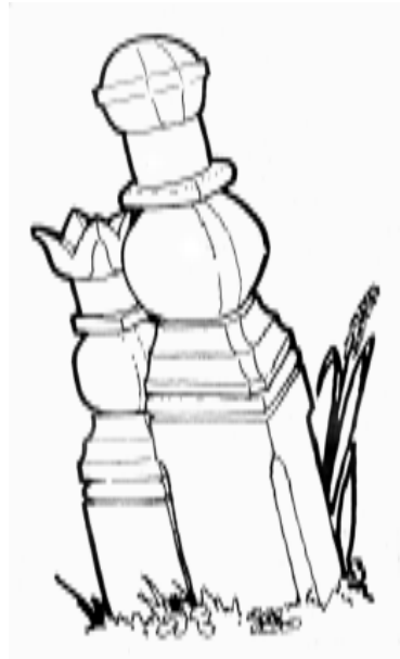
Abielupaari päitsipuu, tulbiga tipus on naise oma. Hadadnásd (Nadižul Hododului, Rumeenia). Kós 1972: 174. 24. joonis

19. ja 20. sajandi ungari rahvakultuuris oli kalmistutel olemas omapärane esemeline märgikeel, haudadel seisvate hauatähiste maailm. Loomulikult tähistati veel väga paljudes paikades peale Ungari haudu nikerdatud puusammaste või hauakividega, niisiis pole päitsipuude erilisus mitte selles, vaid omapära peab otsima pigem rikkalikus vormivaras ja märkide vaheldusrikkuses, süsteemi täiuslikkuses. Ungari