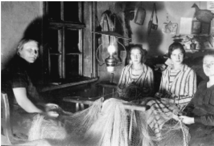
Foto 6. Räimevõrkude parandamine. Kuolka küla.