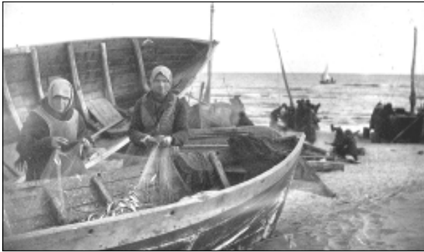
Foto 2. Võrgust räimede noppimine. Teine paat on küljega, et kaitsta tuule eest. Mustanumi küla.

mus, nagu ka muud sigadega seotud kalendripärimused, kajastab sigade lahtiselt pidamist. Liivlastel olid sageli taradega ümbritsetud just põllulapid, muu maa, mets ja rannaäär olid loomadel vabalt käia. Niimoodi lahtiselt luusivad sead võisid muidugi sattuda ka kuivama pandud võrkude juurde ja neid lõhkuda. Võrkude parandamine oli suur lisatöö ja teadagi püüti seda igal moel vältida.