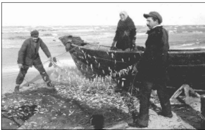
Foto 7. Räimevõrgu tühjaksraputamine. Koštrõgi küla.

Pöördume nüüd jälle kindla kuupäevaga seotud tähtpäevade juurde. O. Loorits on küll väitnud, et kevadine nigulapäev (9. mai) on liivi rahvakalendris tundmatu (Loorits 1950, 72), kuid see ei pea paika. Kevadise nigulapäeva loodustähelepanekutest oli liivlastele omane arvamus, et sellel päeval saabuvad toonekured. Mere ja kalandusega seob niisuguse loodustähelepaneku üks kaunis hämaralt sõnastatud Saarimaa tekst. Nimelt uskunud liivlased, et kui toonekurg sel päeval maha laskus (soomekeelses kirjapanekus “putosi maahan”), siis uppus sel aastal merre palju mehi. Uskumuse aluseks olevatest mõttekonstruktsioonidest võiks eelkõige arvesse tulla tuntud uskumus rändlindude ühendusest surnuteriigiga, mis on liivlastelgi elanud kõrvuti usuga lindude talveunne ja millel põhineb “linnupette” võtmise komme (Loorits 1949, 355–359). Toonekure puhul ilmneb seos surnuteriigiga väga selgelt linnu eestikeelses nimes, kuid ka liivikeelne piva-