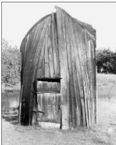
Foto 1. Paadipooltest tehtud suveköök Koštrõgi külas. Foto G. Ränk 1943. ERMi fotokogu.

Ka liivi traditsioonis on tõnisepäev eeskätt sigadega seotud. Sigade edenemist taotleti seapea keetmise ja söömisega, luude metsaviimise ja mitmesuguste keeldude järgimisega. Nii ei tohtinud tõnisepäeval pead kammida – see pidi sigadele täid selga tekitama. Mitmesuguste sanktsioonidega olid keelatud erinevad villase ja linase materjaliga tehtavad käsitööd. Niisama nagu eestlased ja lätlased, kartsid ka liivlased vastasel juhul sigade haigeksjäämist, kuid niisugune sanktsioon oli liivi traditsioonis siiski küllalt kõrvalise tähendusega. Palju olulisem oli mitmeastmelisel mõttekäigul põhinev uskumus, mille kohaselt sigade pühal keelatud tööde tegemise eest karistatakse keelu eirajat nii, et sead pole ise kannatajad, vaid karistuse täideviijad. Nii näiteks arvati, et nad söövad ära villase käsitöö tegijate lambatalled. Analoogiline on ka järgmine sanktsioon, mis oli kalureile eriti tähtis: neil, kes tõnisepäeval võrku kudusid, üldse võrkude kallal töötasid, võrgulõnga ketrasid või tegid midagi muud linasega seotut, pidid sead suvel randa kuivama pandud võrgud puruks rebima. Tuleb silmas pidada, et see usku-