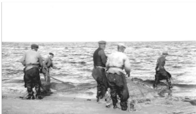
Foto 3. Võrguvedajad. Sikrõgi küla. Foto B. Dziadkowsky 1936. ERMi fotokogu.

Kindel seos kaluritööga on liivi rahvatraditsioonis vastlapäeval. Kuigi liikuva pühana võib vastlapäev sattuda varasematel puhkudel juba veebruari algupoolde, mil talv on veel täies jõus, on teda siiski peetud kevade lähenemise märkijaks. Kalurite jaoks tähendas see ühtlasi püügihooaja lähenemist ja tuletas