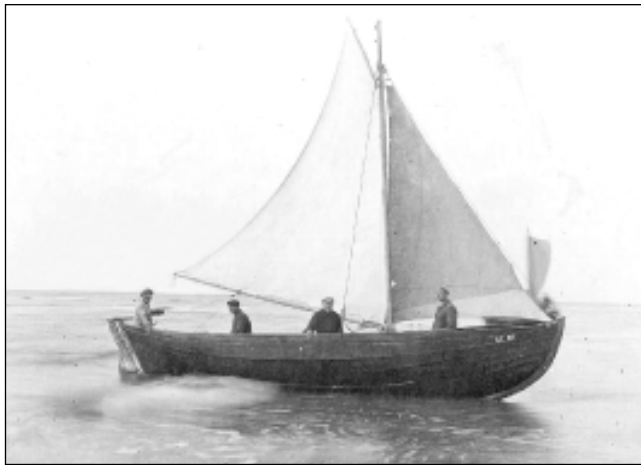
Foto 8. Neljameheline räimepaat. Koštrõgi küla.

Jõulu- ja nääriöist taevast, samuti härmatist puudel nendel öödel jälgisid ka liivlaste naabrid. Nii eestlased kui lätlased on neist loodusnähtustest välja lugenud mitmesuguseid tulevikumärke. Sealjuures väärivad märkimist, et mõlemad nimetatud on tundnud selliseidki ühiseid endeid, mis vähemalt fikseeritud liivi materjalis puuduvad ja mis käivad uue aasta viljasaagi kohta. Samal ajal on liivlastelt siiski üks teade niisugusest nii eestlastel kui lätlastel (ja paljudel muudel rahvastel) tuntud uskumusest, mille kohaselt tähine taevas jõulu- või nääriööl ennustab noorloomade kordaminekut. Siinkohal näib küll selgesti avalduvat