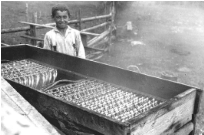
Foto 4. Räimede suitsetamine. Koštrõgi küla. 1928. a.

Eesti kalurid pole vastlapäeval pidulikumat kokkutulekut harrastanud, küll on aga seda teinud Liivi lahe äärsed läti kalurid (Loorits 1958, 129–130). Nagu näeme, on siin tegemist liivi ja läti traditsioonide kokkukuulumisega. See on omane vastlapäevakommetele üldisemaltki, sest ka vastlasandid on kõigist liivi santidest kõige lätipärasemad. Kuigi Eestistki leidub mõni teade vastlapäeva seosest kalandusega, on need hoopis teiselaadsed, nagu näiteks püügiõnne taotleva