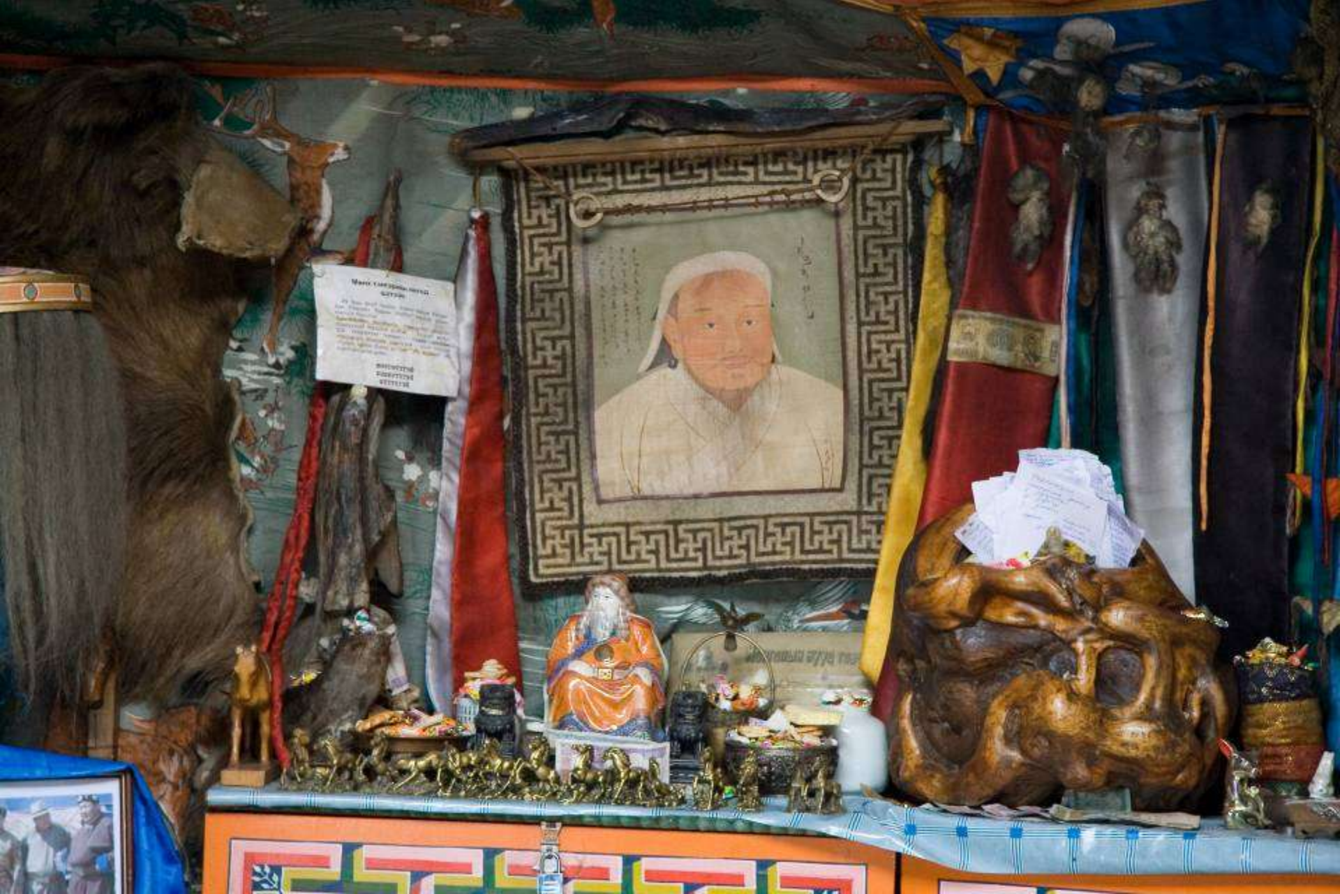
Tšingis-khaani pildiga “altar” Dondog Bjambadorži šamaanijurtas.