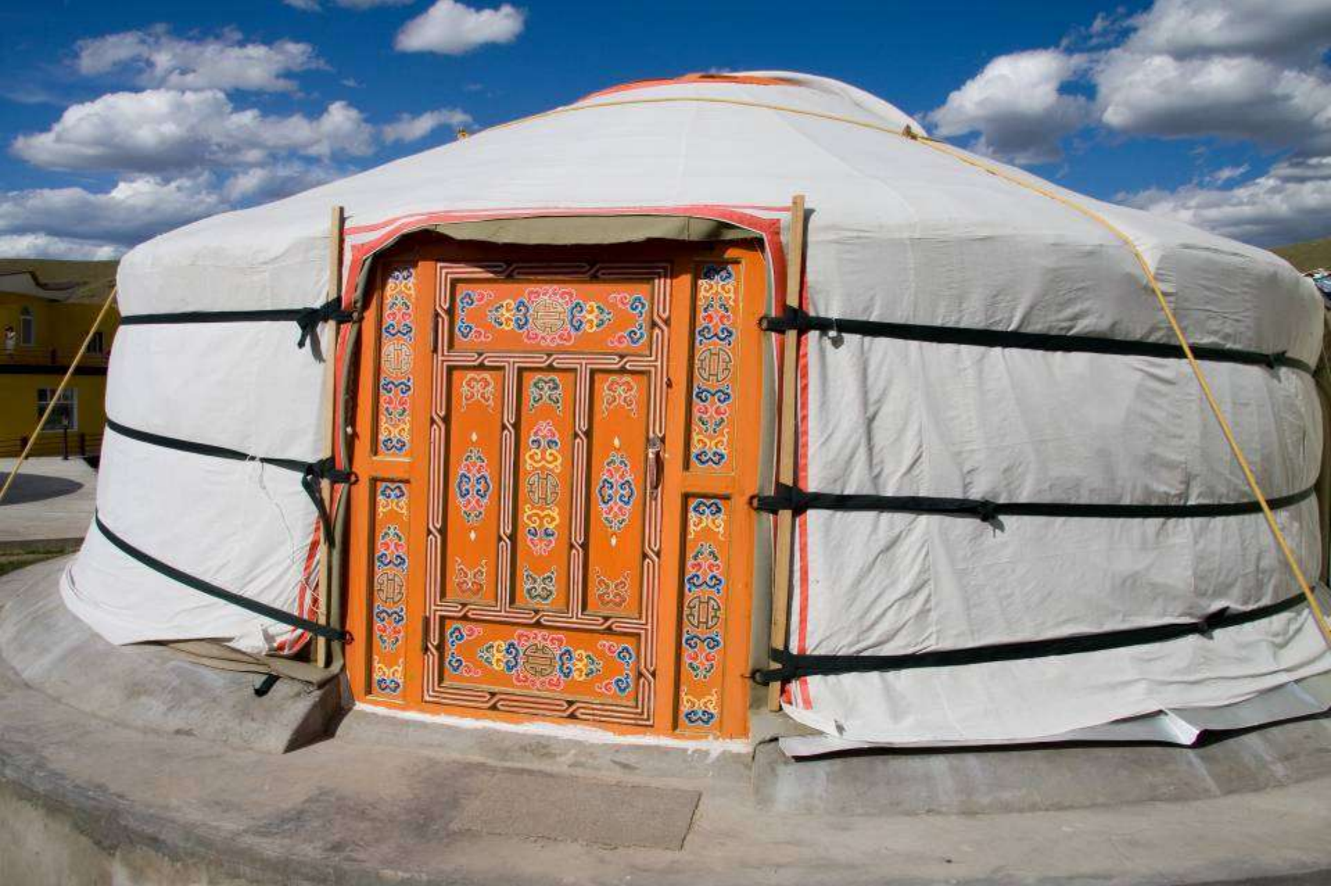
Traditsiooniline mongoli elamu - ger