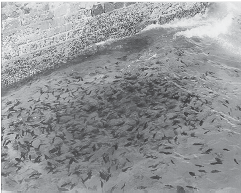
Blackfish'i parv Ascensioni sadamakai ääres kalarappeid ootamas

elus enne püüdnud — pikkus ninast sabahargini 206 cm, kaaluks pakkusid erinevad hindajad nelikümmend kilo. Saime suure ämbritäie puhast fileed ja tõhusat täiendust oma pikal ülesõidul kokkukuivanud menüüsse.