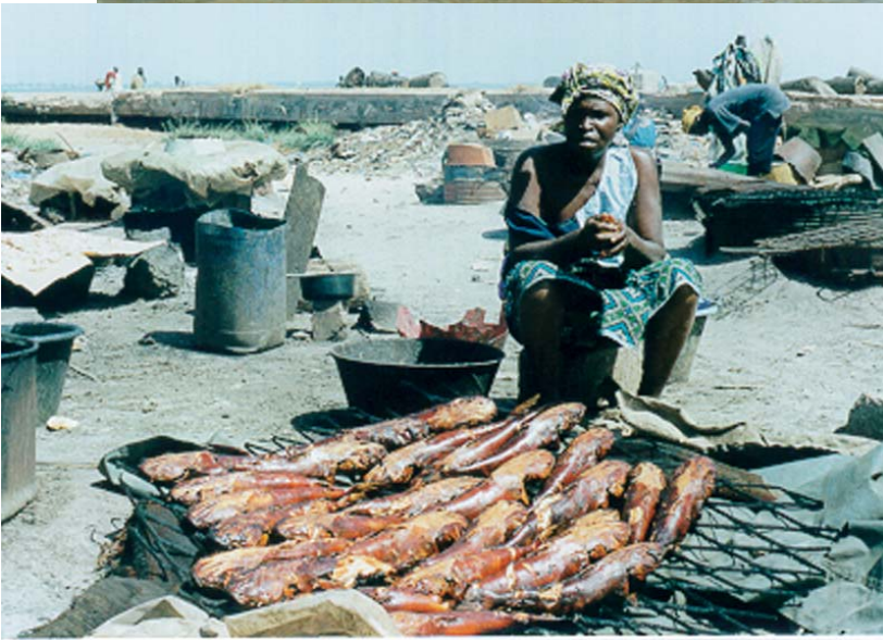
Gambia kalurid ookeanipiroogis kalaleminekuks valmistumas ja neegritädi rannal kala suitsutamas