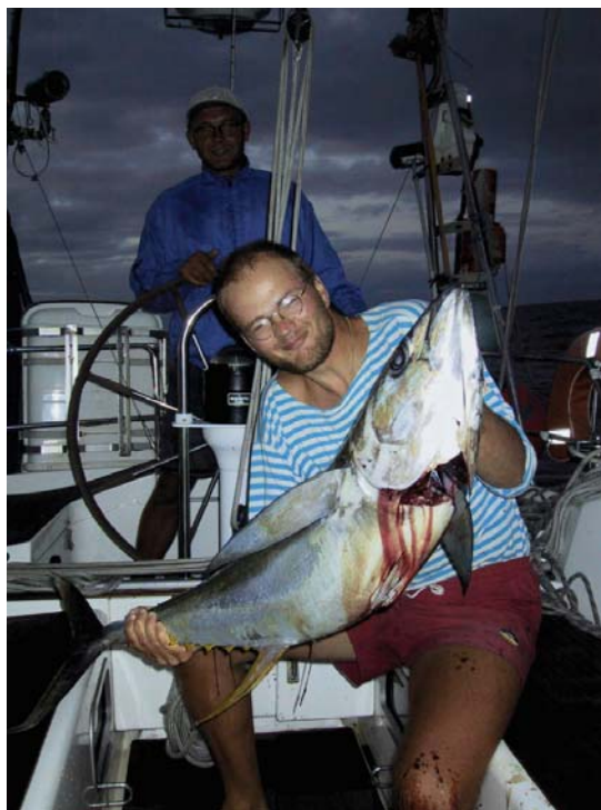
Tuunikala varahommikul Ascensionil reidil

Vastuvõtt osutus üllatavalt soojaks. Olud on muutunud, NASA baas on välja viidud ja külalisjahte ootab warm welcome ... Kui kaldale saab, muidugi-mõistata – maabumine on sõna otsese mõttes