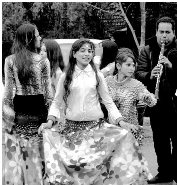
Foto 6. Radomiri mustlastüdrukud esinemisjärge ootamas. Foto Andres Kuperjanov 2010.