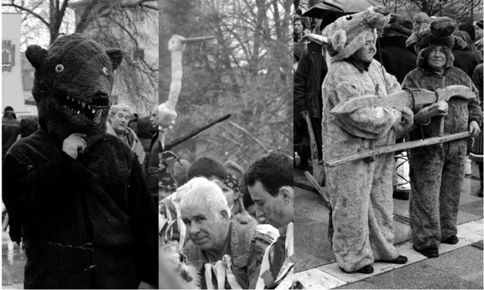
Foto 4. Vanemate maskitüüpide hulka kuuluvad karu ja toonekurg, samuti künnihärjad.