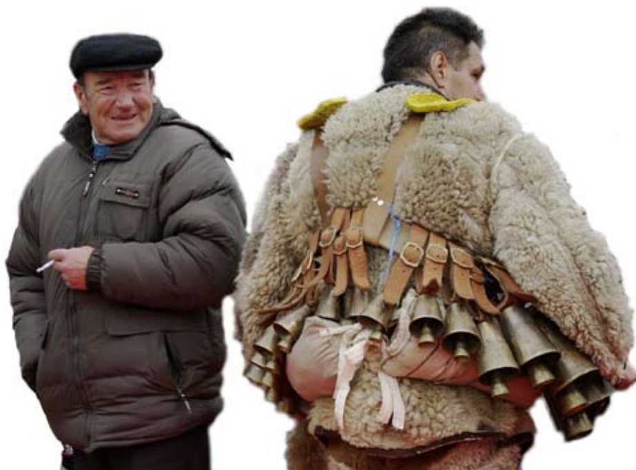
Foto 2. Külamehed omavahel.