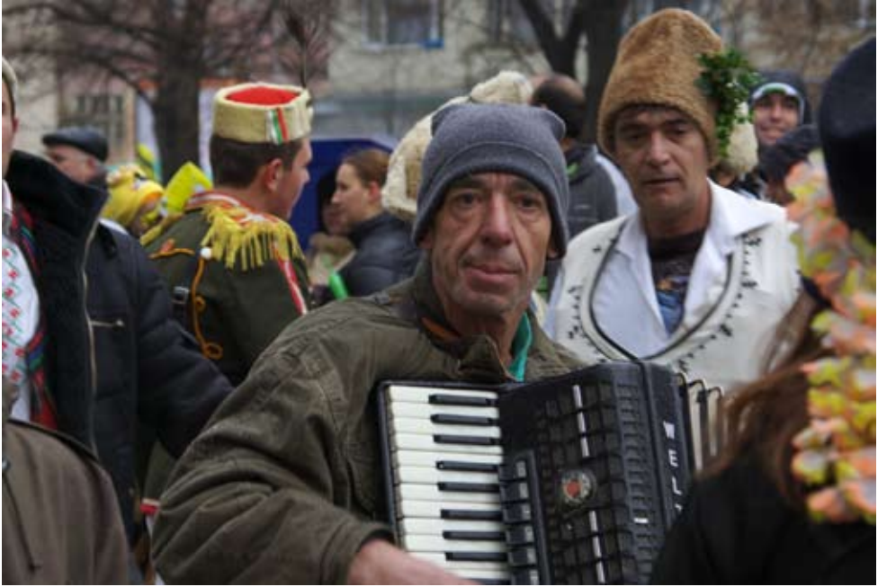
Foto 9. Peaaegu iga rühma juurde kuulusid muusikud.