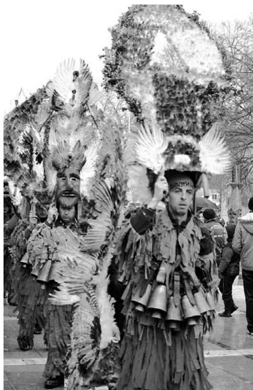
Foto 5. Perniku piirkonnale tüüpilised kõrged maskid.