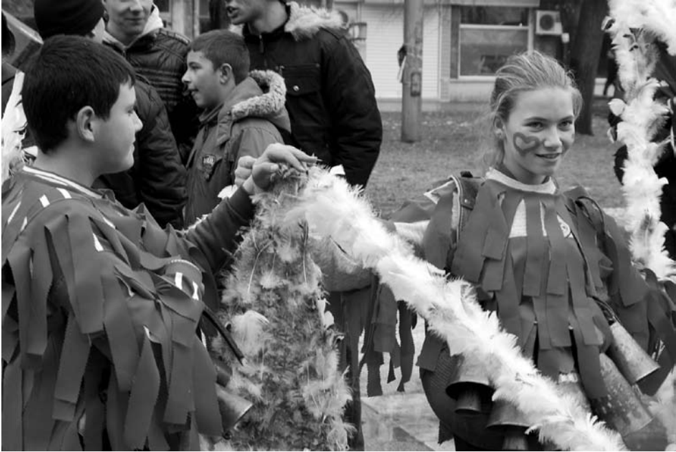
Foto 11. Noorterühmadesse kuuluvad poisid ja tüdrukud.