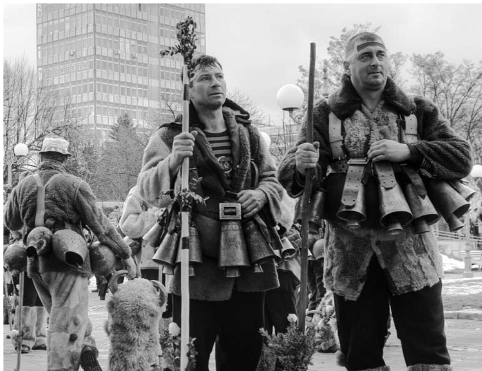
Foto 3. Kõige tavalisemad kukerid – loomanahad ümber, kellad võöl ja vahel ka loomasarvedega maskid.