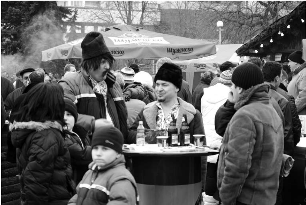
Foto 7. Festivali puhul avati ajutised söögi- ja joogikohad.