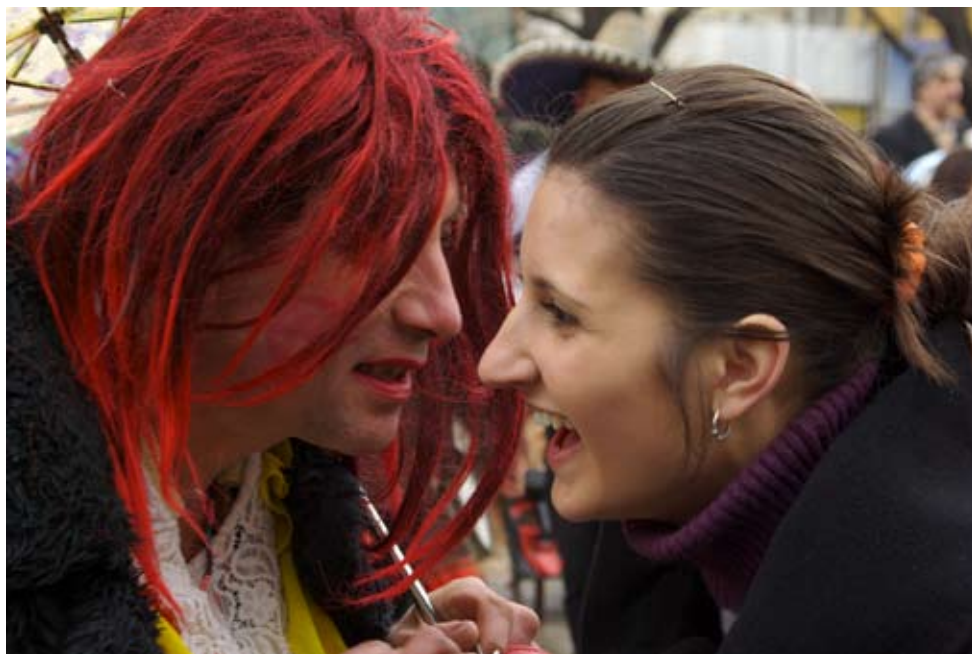
Foto 10. Esinejate ja publiku piirid ähmastuvad.