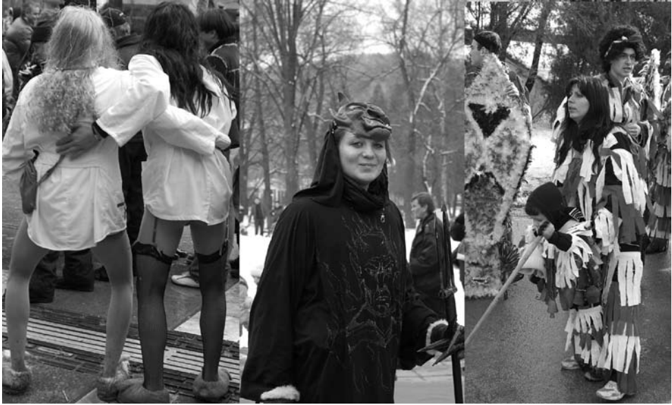
Foto 7. Maskeeritute seas on naisteks riietunud mehi, naiskuradeid ja kukeriperekondi.