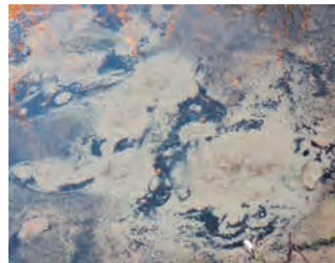
Allikas Haibas. Riina Lotamõis 2021

Rohkelt lugusid on seotud kõrgendikega, kus teatakse kedagi hukatud või maetud olevat. Hageri Völlaste- ehk Völlamäel hukatud mõisaajal inimesi, mistõttu ei ole