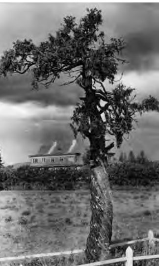
Kernu kadakas. HMK F 4014. 1969