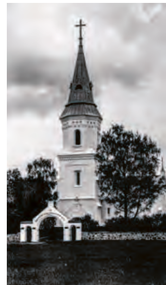
Hageri kirik. EFA.554.0.182544.