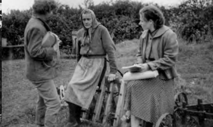
Rahvaluulekogujad Loone linnusel.