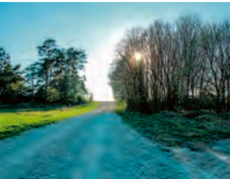
Vaade ristikivi asukohale ja Võllamäele. Jüri Metssalu 2017