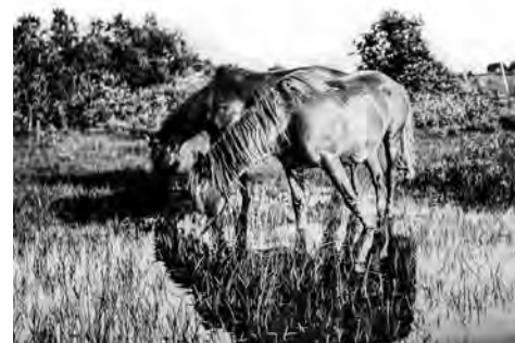
Hobused Adila küla rabakoplis. EPM FP 316:8. Paul Tamm 1923