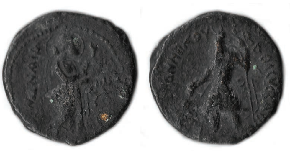
Illustratsioon 1. Kušaanide didrahm. Esikülg: kuningas seisab vasakul altari kõrval, käes oda. Kreeka legend: ΒΑΣΙΛΕΥΣ ΒΑΣΙΛΕΩΝ ΚΑΝΗΡΚΟΥ (“Kaniška, kuningate kuninga [münt]”). Tagakülg: nimbusega jumalanna Nanāia seisab paremal, kreeka legend: ΝΑΝΑΙΑ vasakpoolsel väljal.