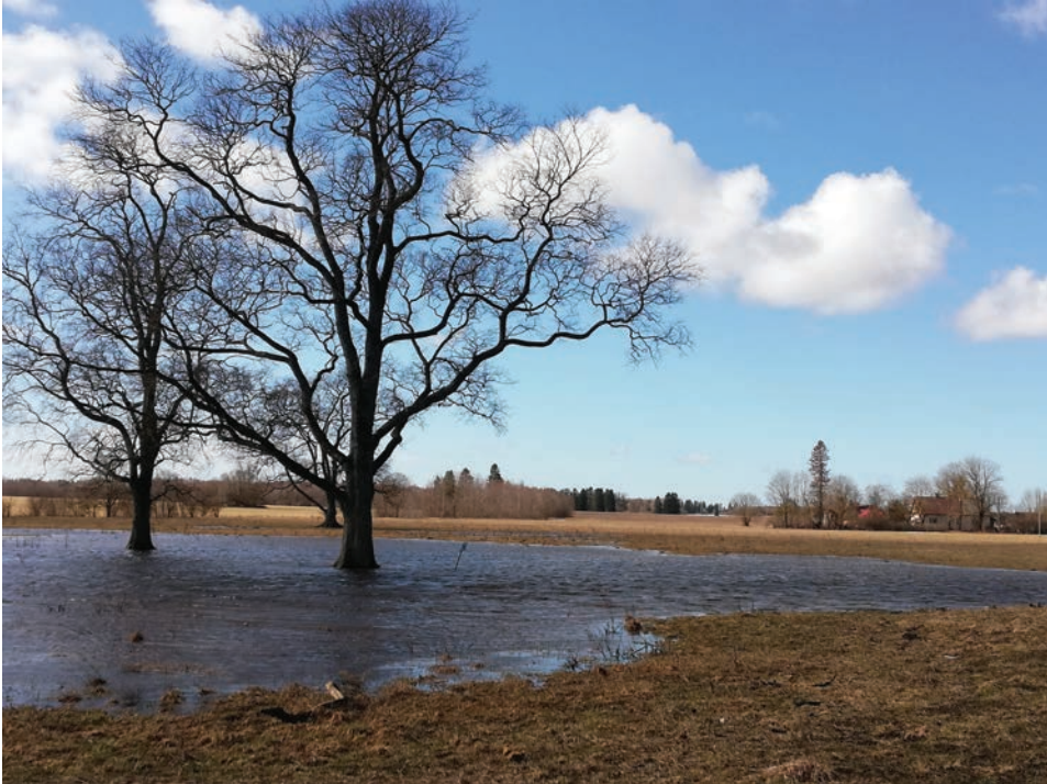
Foto 4. Kurena hiiepuud seisavad kevadise suurvee ajal jalgupidi vees.