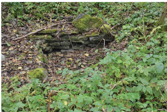
Foto 1. Maardu Hiie-metsa pühaks peetud Kummiallika paekivist rakked oktoobris.