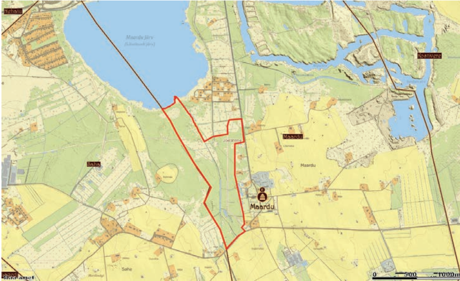
Joonis 2. Maardu hiiemetsa orienteeruvad piirid pärimusteadete põhjal praegustes oludes.

Maardu juhtumi puhul aitas just vesi (allikad, järve suubuv oja) – lisaks kunagisele mõisamaid eraldavale kiviaiale – määrata hiieala piire ning sidus selle ka järvega, mille põhjas leidub samuti allikaid. Järve olulisus nähtub ka järgnevatel paralleelidel.