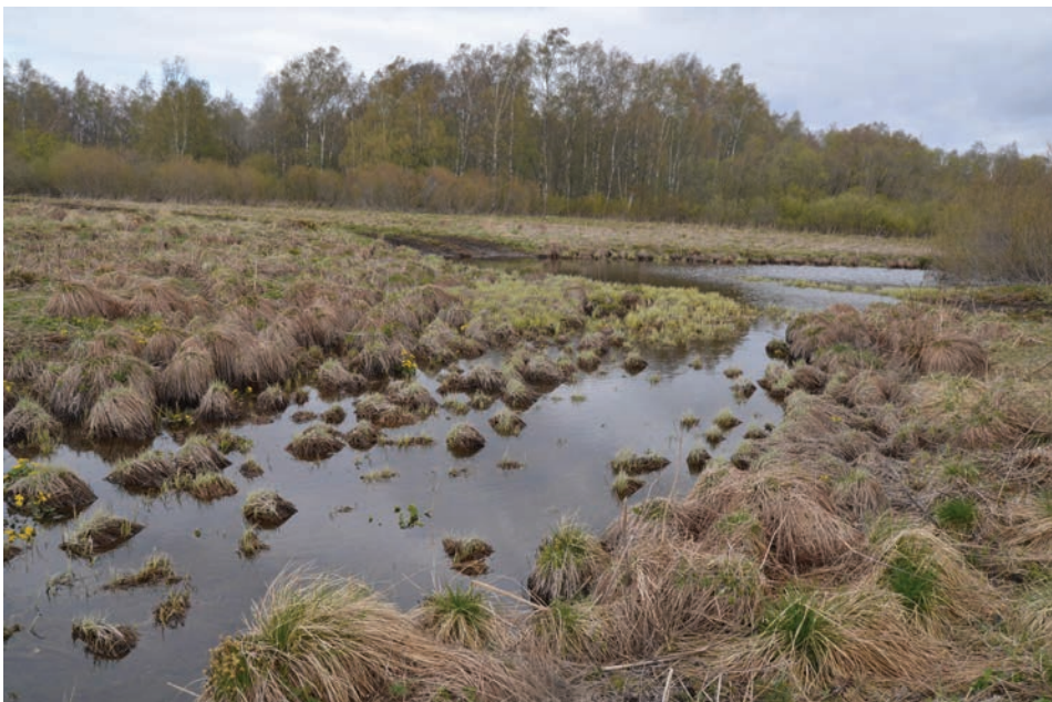
Foto 5. Haljala kihelkonna Katela küla Hiieoja. Mari-Ann Remmeli foto 2019.

Pühaks peetud alad oma vahelduva reljeefiga võivad muuhulgas olla ulatusliku- ma vetevõrgu lähte- või hargnemispunktid ning uskumused kajastavad nende otseühendust ka taevanähtustega, ilmastikuga, kliimaga üldisemas mõttes.