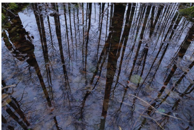
Foto 2. Üleujutatud Kummiallikas sama aasta novembris.