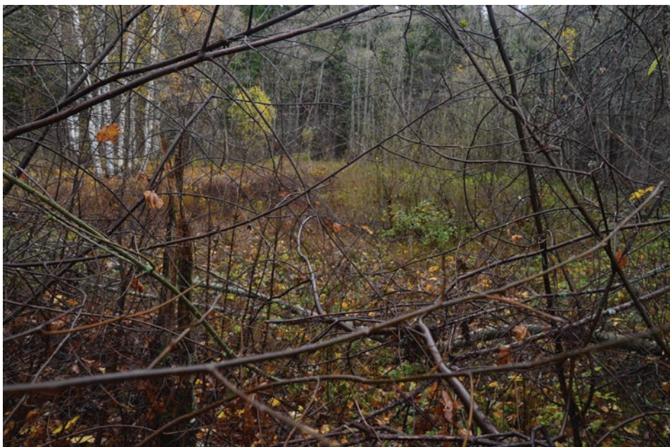
Foto 3. Hiieauk Eassalu Pangamägedes oli sügisel kuiv.