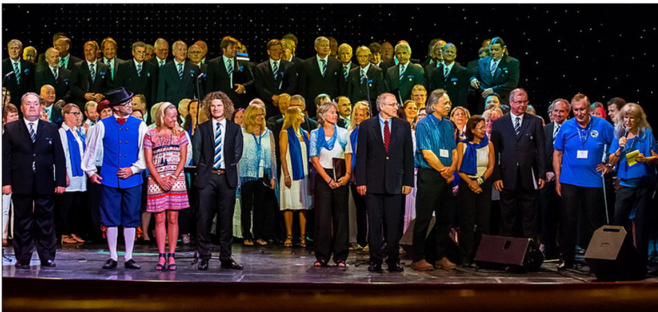
Välis-estlaste 2015. aasta kultuuripeo "Üle ilma" lõppkontserdi tänuhetk. Iivi Zajedova foto 2015.