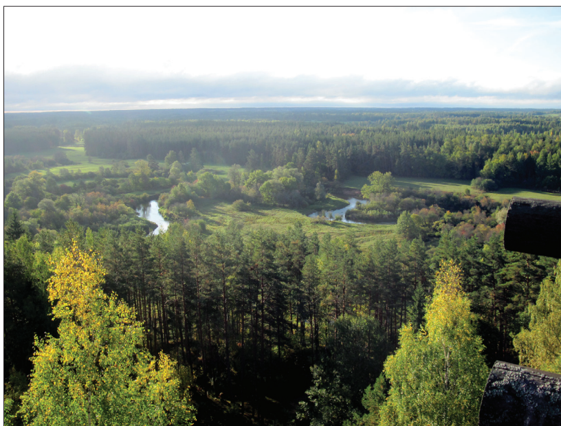
Foto 3. Vaade Tellingumäe vaatetornist kihelkonnale ja Mustjõeale koos vanajõgedega. Marju Kõivupuu foto 2013.