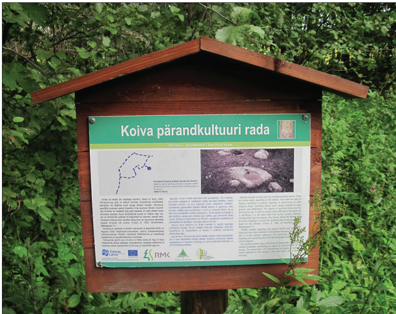
Fotod 7. ja 8. Eksitajad maastikul: Tellingumäe püha kivi ja tema kohta käiv infotahvel. Marju Kõivupuud fotod 2012.