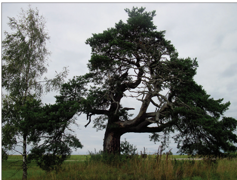
Foto 6. Hargla püha pedajas.

Kas Hargla omaaegsete kirikuõpetajate poolt talletatud sinise rahva ohverdamiskommete kirjeldusi saab siduda just konkreetselt selle puuga, on iseküsimus. Osundatav tekst, mille sihtrühmaks on matkajad ja turistid, on ilmselt