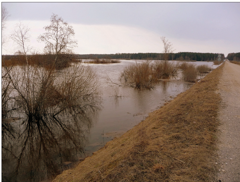
Foto 2. Üleujutus kevadisel Mustjõel. Fotol on näha on endise Valga–Ape kitsarööpmelise raudtee tamm, praegu kasutusel sõiduteena. Marju Kõivupuu foto aprill 2009.