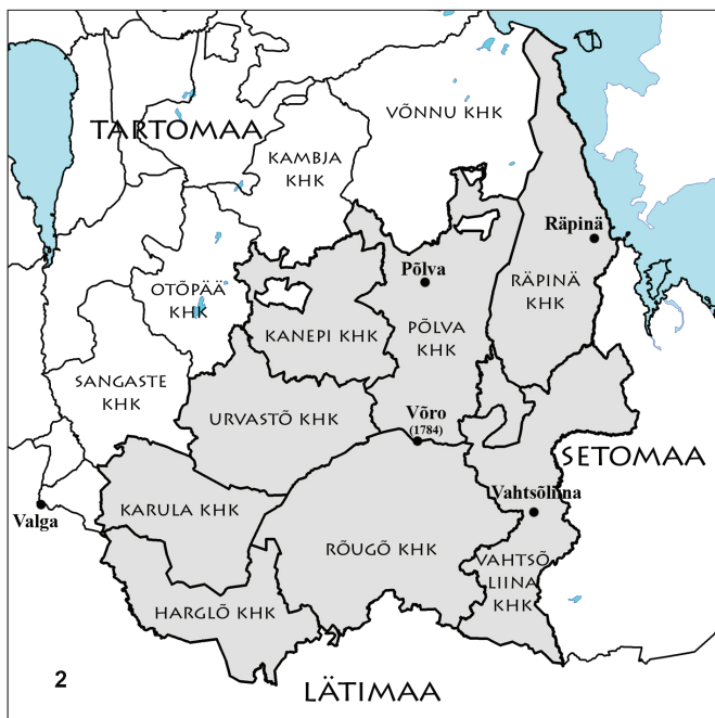
Joonis 2. Kaardid: 1 Harglata, 2 Harglaga. Kaartide autorid Arvis Kiristaja ja Evar Saar.