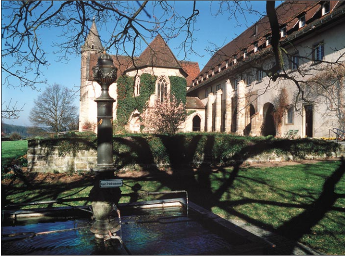
Joonis 2. Lorchi klooster: Pärimuse järgi asutasid kloostri 12. ja 13. sajandi vahetusel Švaabimaa hertsog Friedrich I ja tema kaasa, Saksa-Rooma keisri Heinrich IV tütar Agnes von Franken Staufide (Hohenstaufenite) matmispaigaks.

teostest leida ajaloolist tõe ja kaitsevad seda siis kangelaslikult nn teadlaste tsunfti tagakiusamise eest. 15